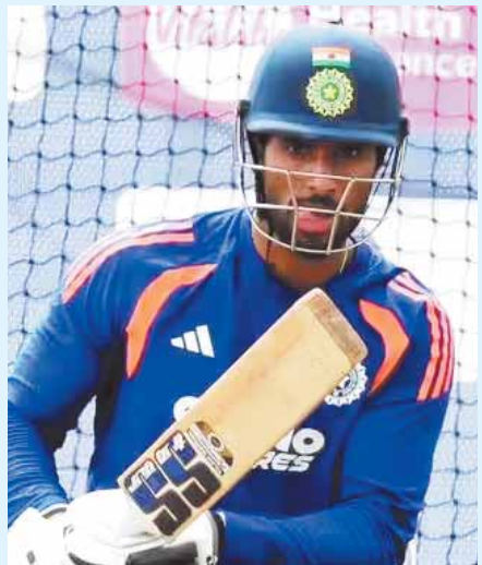
नई दिल्ली, एजेंसी

पाकिस्तान क्रिकेट में 2023 से कपड़ों की तरफ कप्तान बदल रहे हैं। पीसीबी ने वनडे और टी20 इंटरनेशनल के कप्तान कई बार बदल दिए। वहीं 2023 में बाबर आजम की जगह शान मसूद टेस्ट के कप्तान बने थे। उन्हें हटाकर एक बार फिर बाबर को कप्तान बना दिया है। भारतीय क्रिकेट टीम में वही हाल उपकप्तान का है। टी20 और टेस्ट क्रिकेट में बार-बार उपकप्तान बदले जा रहे हैं।