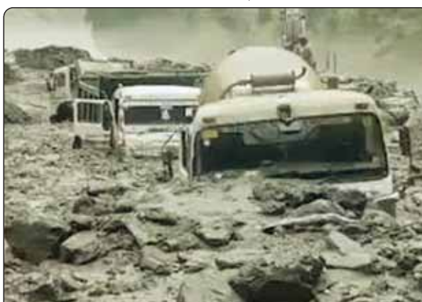
जम्मू-कश्मीर के किरतवाड़ में बारिश के बाद लैंडस्लाइड से दबी गाड़ियां।