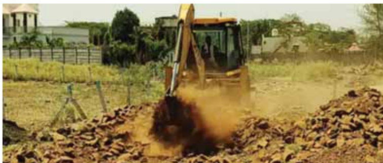
ग्राम फंदाकला में मानसरोवर धाम कॉलोनी द्वारा शासकीय भूमि पर एवं शासकीय नाले की भूमि पर किए गए अतिक्रमण को हटाया गया।

बता दें कि एनजीटी ने निगम को कार्रवाई के लिए तीन सप्ताह की अंतिम मोहलत दी थी, जो 19 मई को समाप्त हो चुकी है। मामले की अगली सुनवाई 9 जुलाई को होना है। सुनवाई के दौरान निगम और प्रशासन को टिब्यूनल में एटीआर पेश करनी है। इसके चलते अफसरों ने कार्रवाई की रिपोर्ट तैयार की है। रिपोर्ट के मुताबिक, सेवनिया गौड, गौरा विशनखेड़ी और प्रेमपुरा क्षेत्र में अतिक्रमण हटाने की कार्रवाई की जाएगी। सर्वे में चिन्हित 21 अतिक्रमणों में से तीन निर्माण वर्ष 2022 से पहले के हैं, जबकि बाकी 18 निर्माण 2022 के बाद किए गए बताए गए हैं। जानकारी के अनुसार, 5 फरवरी से शुरू हुए सीमांकन अभियान के दौरान जिला प्रशासन ने 37 दिन में बड़े तालाब क्षेत्र के 347 अतिक्रमण चिन्हित किए थे, लेकिन 92 दिन बीतने के बाद भी अब तक केवल 51 छोटे अतिक्रमण ही हटाए जा सके हैं। इनमें टीटी नगर क्षेत्र के 39 और बैरागढ़ क्षेत्र के 12 अतिक्रमण शामिल हैं। 296 अतिक्रमण अब भी