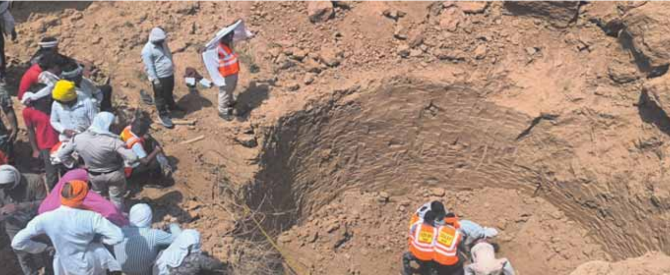
पन्ना। दोपहर मेटी

पन्ना जिले गत दिवस एक बड़ा हादसा हो गया। अजयगढ़ जनपद अंतर्गत ग्राम बीछपुरवा के नयापुरवा में मंगलवार को कुएँ की खुदाई के दौरान अचानक मिट्टी धंस गई। खेत में अचानक मिट्टी धंसने से पांच मजदूर कुएँ के भीतर दब गए। घटना के बाद पूरे इलाके में अफ़स-तपरी मच गई और गांव में चीख-पुकार के बीच रहत एवं बचाव कार्य शुरू किया गया। हादसे के बाद कई घंटों की मशक़त के बाद 5 मजदूर के शव निकाले गए हैं। एएसपी ने इसकी पुष्टि की है। फ़िलहाल रेस्क्यू ऑपरेशन जारी है।