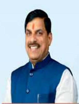
डॉ. मोहन यादव मुख्यमंत्री