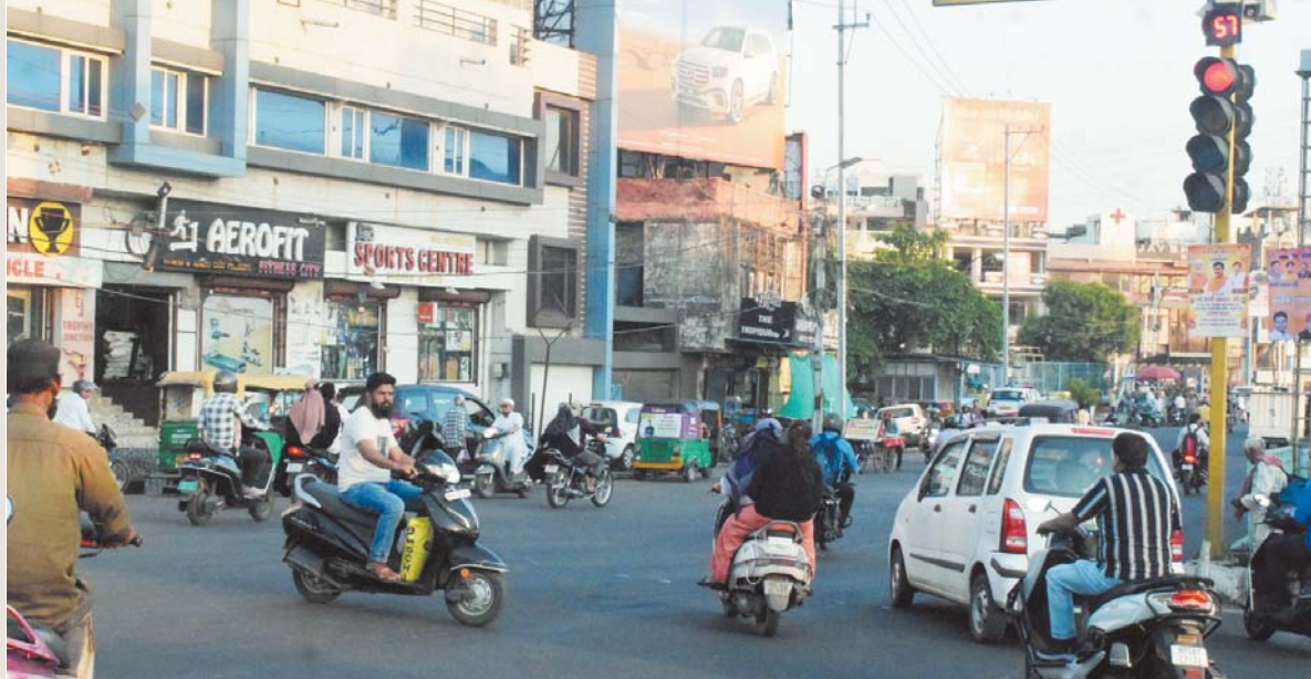
भोपाल। रेल घाट चौराहे पर ट्रैफिक व्यवस्था दिन-ब-दिन बिगड़ती जा रही है। शहर के व्यस्ततम चौराहों में शामिल इस इलाके में यातायात नियमों की खुलेआम धजियां उड़ाई जा रही हैं, लेकिन यातायात पुलिस की ओर से कोई ठोस कार्रवाई नजर नहीं आ रही। चौराहे पर हालात ऐसे हैं कि सिग्नल चालू होने के बावजूद वाहन चालक अपनी मनमर्जी से गाड़ियां निकाल रहे हैं। कोई वाहन दाईं ओर से निकल रहा है तो कोई गलत दिशा में घुसकर ट्रैफिक जाम बढ़ा रहा है।