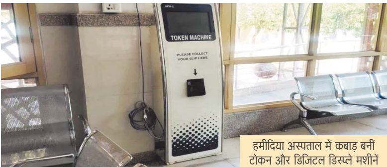
हमीदिया अस्पताल में कबाड़ बनी टोकन और डिजिटल डिस्पले मशीनें

टोकन व्यवस्था बंद होने का सबसे सीधा असर ओपीडी पर्चा काउंटर और दवा वितरण केंद्रों पर देखने को मिल रहा है। चूंकि अब मरीजों को कोई टोकन नंबर नहीं मिल रहा है, इसलिए हर कोई पहले पर्चा बनवाने और दवा लेने की होड़ में लगा है। इसके चलते काउंटरों पर मरीजों की भारी भीड़ उमड़ रही है। कतारों में अव्यवस्था फैलने के कारण मरीजों के बीच आपस में और वहां तैनात सुरक्षाकर्मियों के साथ आए दिन धक्का-मुक्की और तीखी बहस की स्थिति बन रही है। डिजिटल स्क्रीन बंद होने से मरीजों को यह भी पता नहीं चल पा रहा है कि उनका नंबर कब आएगा या डॉक्टर कब बैठेंगे।