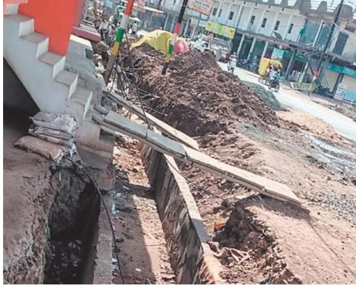
नाला सड़क से केवल 6 इंच नीचा रहेगा

तहसील रोड पर नगर पालिका द्वारा बनाया जा रहा नाला रहवासियों के लिए बड़ी मुसीबत बनता दिखाई दे रहा है। 2 साल पहले स्वीकृत हुए 36 लाख की लागत वाले इस नाले का निर्माण नया बमुश्किल 6 महीने पहले शुरू करवा सकी थी। इसके पहले लगातार इस नाले के टेंडर निरस्त हुए। जब निर्माण कार्य शुरू हुआ तो रहवासियों को उम्मीद बंधी कि काम जल्द ही पूरा हो जाएगा। उनकी यह उम्मीद धरी की धरी रह गई। निर्माण एजेंसी डायमंड कंस्ट्रक्शन ने इतनी धीमी गति से काम किया कि 6 महीने में आधा काम भी नहीं हो सका। निर्माण की इस प्रक्रिया में अब रहवासियों के सामने दूसरी बड़ी समस्या भी सामने आ रही है। निर्माण एजेंसी द्वारा करीब 4 फीट गहराई वाला यह नाला कुछ हिस्सों में सड़क से 2 से 3 फीट नीचे बनाया जा रहा है। इन हालातों में नाले के पास में रहने वाले लोगों को बड़ी दिक्कतों का सामना करना पड़ रहा है। उन्हें अपने घर की पहुंचने के लिए स्लोवनुमा लकड़ी के पटिए या फर्षी लगाना पड़ रही है। इसके बाद वे अपने घर में पहुंच पा रहे हैं। रहवासियों का कहना है कि घर के आगे ही तीन फीट गहराई वाला नाला बनने से हमेशा दुर्घटना का अंदेश बना रहेगा। समझ नहीं आ रहा कि जिम्मेदारों को हमारी परेशानी दिखाई क्यों नहीं दे रही।