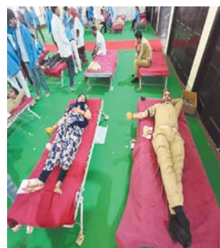
लग गई, जिसमें युवाओं और महिलाओं ने बढ़-चढ़कर अपनी