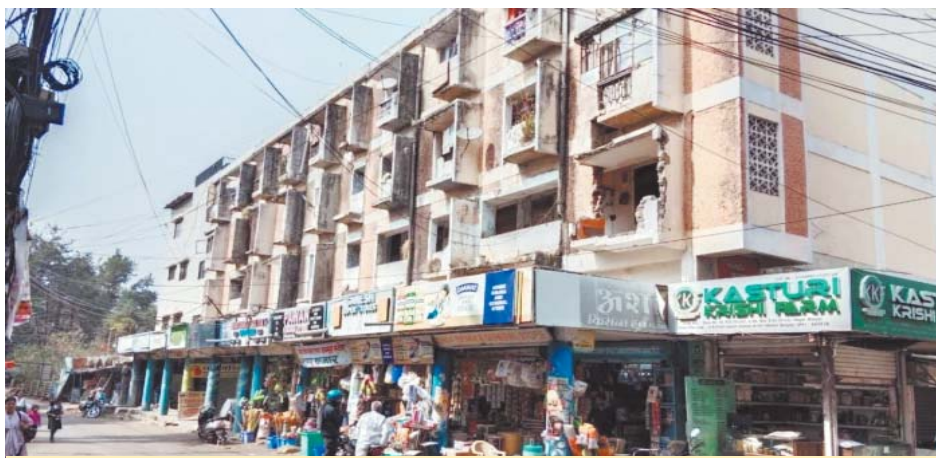
पांच नंबर मार्केट की 65 दुकानें की शिफ्टिंग अगले हफ्ते शुरू हो जाएगी। जून से शुरू होगा 650 करोड़ का री-डेवलपमेंट प्रोजेक्ट।

करीब 650 करोड़ रुपये की लागत से बनने वाले इस प्रोजेक्ट में 45 साल पुराने जर्जर मार्केट की जगह 20-20 मंजिला आठ आधुनिक टावर तैयार किए जाएंगे। हाउसिंग बोर्ड ने प्रोजेक्ट को 42 महीनों में पूरा करने का लक्ष्य तय किया है।