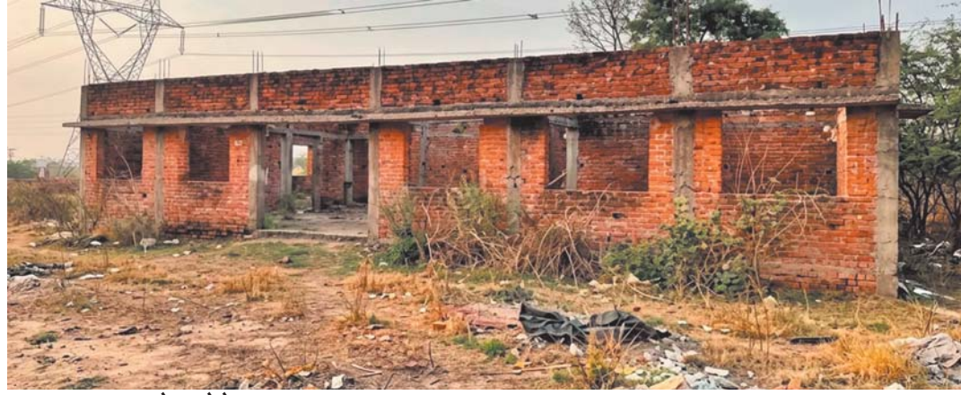
छतरपुर। दोपहर मेट्रो

करने को मजबूर हैं। जिले के नगरीय और ग्रामीण क्षेत्रों में स्कूल भवनों के सालों से अधूरे पड़े रहने के मामले लगातार सामने आ रहे हैं। हैरानी की बात यह है कि जिन भवनों के लिए बजट जारी हुआ, उनकी पूरी राशि संबंधित एजेंसियों ने निकाल ली, लेकिन काम को बीच में ही लटका दिया गया। समय बीतने के साथ ये अधूरे ढांचे अब खंडहर बनते जा रहे हैं। राजापुरवा लवकुशनगर क्षेत्र के वार्ड 8 में करीब 10 साल पहले 8 लाख रुपये की लागत से माध्यमिक स्कूल भवन की