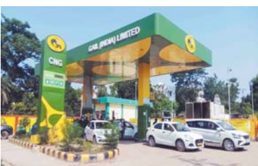
रही है। गौरतलब है कि दो दिन पहले ऑयल कंपनियों ने पेट्रोल और डीजल के रेट 3 रुपए प्रति लीटर तक बढ़ा दिए थे। 15 मई से नई कीमतें लागू हो गईं। यह कीमतें 3.50 रुपए तक बढ़ी है।

भोपाल में एक किग्रा गैस का दाम अब 93.75 रुपए नईदिल्ली/भोपाल, एजेंसी