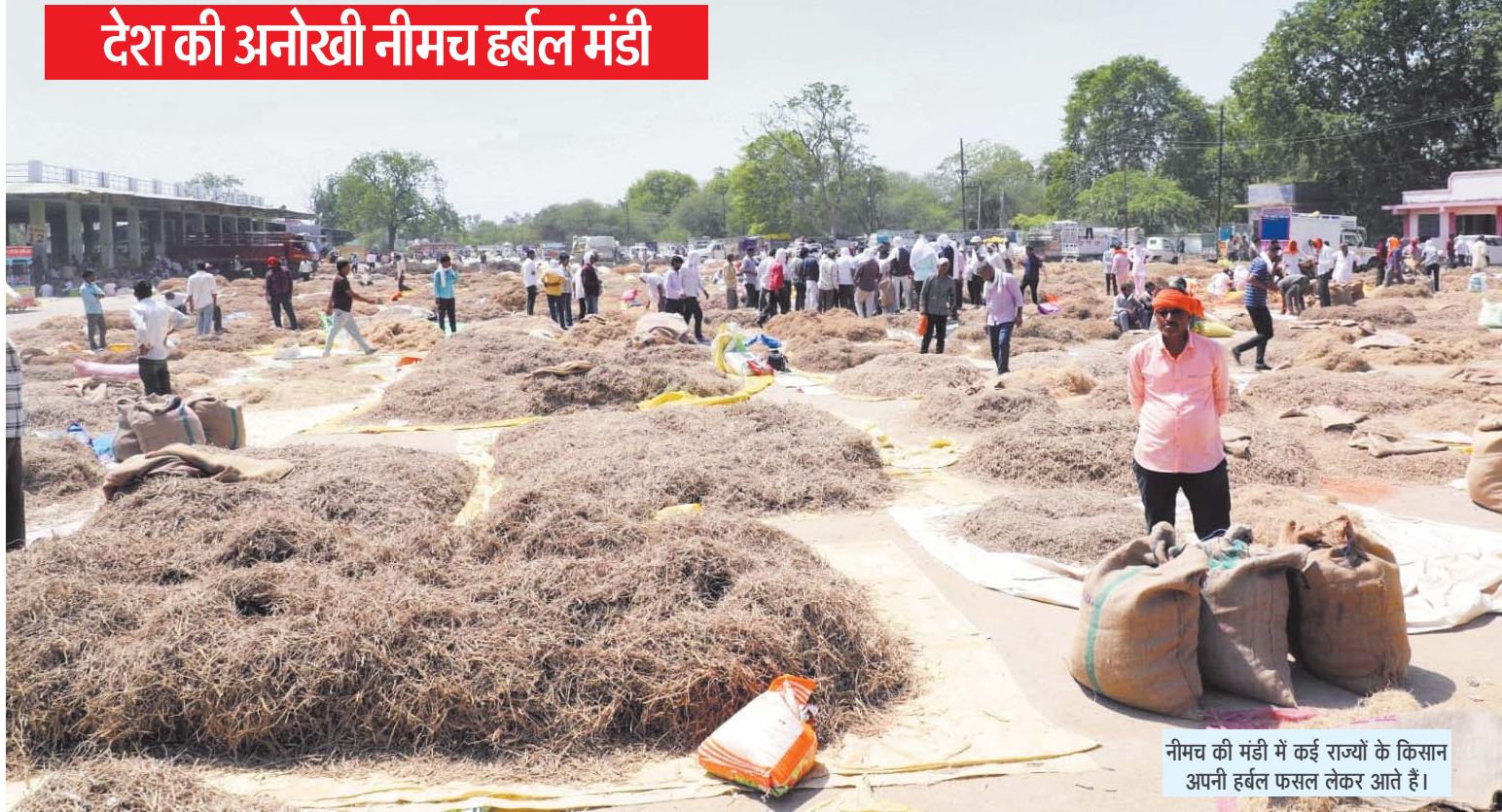
नीमच की मंडी में कई राज्यों के किसान अपनी हर्बल फसल लेकर आते हैं।

फूल, कांटे, पत्ती, छिलके, बीज, छाल, जड़ सभी के मिलते अच्छे दाम