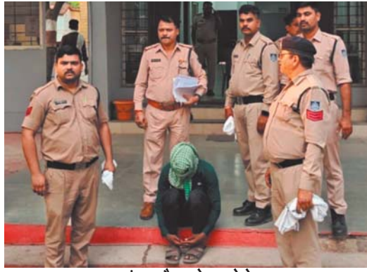
गंजबासोदा। दोपहर मेट्रो