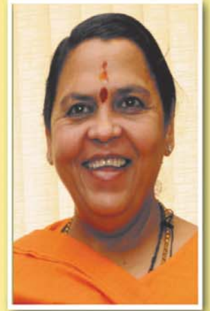
सुश्री उमा भारती पूर्व मुख्यमंत्री