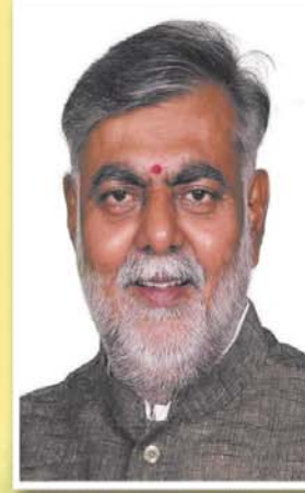
श्री प्रहलाद सिंह पटेल मंत्री, पंचायत एवं ग्रामीण विकास, श्रम