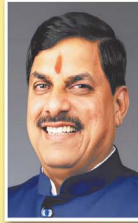
डॉ. मोहन यादव मुख्यमंत्री, मध्यप्रदेश