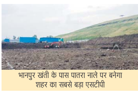
भानपुर खंती के पास पातरा नाले पर बनेगा शहर का सबसे बड़ा एसटीपी

पातरा नाला प्रदूषण का बड़ा स्रोत: पातरा नाला मध्य और नरेला विधानसभा क्षेत्रों से होकर गुजरता है और शहर का सबसे बड़ा नाला माना जाता है। यह नाला भानपुर खंती के पास हलाली डैम में जाकर मिलता है। नगर निगम के सर्वे के अनुसार, नरेला विधानसभा क्षेत्र का लगभग 70 प्रतिशत सीवेज इसी नाले में गिरता है, जिससे प्रदूषण की गंभीर समस्या बनी हुई है। करीब एक वर्ष पहले नगर निगम ने इस नाले को अमृत 2.0 योजना में शामिल किया था। इस परियोजना के तहत चार पैकेज में टेंडर जारी किए गए हैं। कुल 402 करोड़ रुपये की लागत से इस योजना में लगभग 10 ट्रीटमेंट प्लांट बनाए जाने हैं। शहर के विभिन्न हिस्सों में सीवेज नेटवर्क बिछाने का कार्य भी तेजी से चल रहा है।