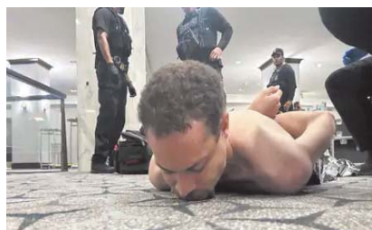
सुरक्षा बलों के घेरे में पकड़ा गया हमलावर।