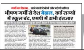
25 अप्रैल को दोपहर मेट्रो में प्रकाशित खबर

राजधानी में बढ़ते तापमान और भीषण गर्मी के चलते जिला प्रशासन ने स्कूली बच्चों के स्वास्थ्य को ध्यान में रखते अवकाश घोषित कर दिया है। भोपाल जिला शिक्षा अधिकारी कार्यालय की तरफ से जारी आदेश के अनुसार, जिले के सभी सरकारी और निजी स्कूलों में 30 अप्रैल 2026 तक अवकाश घोषित कर दिया गया है। यह छुट्टी नर्सरी से कक्षा 8वीं तक के छात्रों के लिए घोषित की गई है। यह आदेश भोपाल जिले के सभी सरकारी, अशासकीय (निजी), अनुदान प्राप्त, सीबीएसई और आईसीएसई स्कूलों पर समान रूप से लागू होगा। आदेश के अनुसार इस दौरान छात्रों के लिए अवकाश रहेगा, लेकिन विद्यालय के सभी शिक्षकों को अपने नियत समय पर विद्यालय में उपस्थित रहना अनिवार्य होगा।