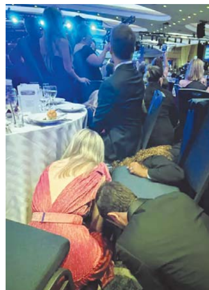
इस तरह कुर्सी-टेबल के नीचे छुपे गेस्ट।

कुछ ही सेकेंड में मैंने देखा कि वेटर अपनी ट्रे लेकर अंदर भाग रहे थे और सुरक्षित जगह दूढ़ रहे थे। तभी मुझे लगा कि कुछ गड़बड़ है। टेबल पर बैठे लोग नीचे छिप गए। जब मुझे लगा कि अब उठना सुरक्षित है, तो मैंने देखा कि