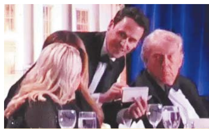
घटना के पहले हॉटेल में मौजूद राष्ट्रपति ट्रम्प।

डिनर की दौरान जैसे ही फायरिंग की आवाज आई, हॉल में बैठे लोग घबराकर टेबल के नीचे छिपने लगे और सुरक्षाकर्मी तुरंत हकमत में आ गए। सीएनएन ने घटना स्थल से सामने आए एक वीडियो के बारे में बताया, जिसमें राष्ट्रपति डोनाल्ड ट्रंप और फर्स्ट लेडी मेलानिया ट्रंप, वाशिंगटन हिल्टन में व्हाइट हाउस कॉरस्पॉन्डेंट्स डिनर में शूटिंग से कुछ देर पहले अमेरिकन मेटल्लिस्ट ओज पलमैन से बात करते हुए दिख रहे हैं। जब पलमैन ट्रंप से बात कर रहे होते हैं, तो अचानक एक तेज आवाज सुनकर लोग घबरा जाते हैं। फर्स्ट लेडी मेलानिया इससे पहले कुछ समझतीं, सिक्वोरिटी ने राष्ट्रपति ट्रंप समेत अन्य को करार करते हुए स्ट्रेज से उतारा। एक और वीडियो में, लोग टेबल के नीचे छिपे होते हैं। आनन-फानन में वहां मौजूद सिक्वोरिटी अमेरिकी राष्ट्रपति के लिए सुरक्षा कवर बनाती है। हमले के करीब डेढ़ घंटे बाद ट्रम्प ने मीडिया को संबोधित किया। उन्होंने कहा-