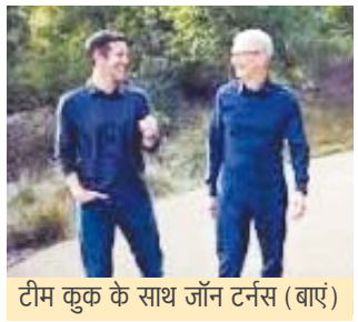
टीम कुक के साथ जॉन टर्नस (बाएं)

दुनिया की सबसे कीमती कंपनी ऐपल ने आखिरकार अपने नए सीईओ के नाम का खुलासा कर ही दिया। बीते 4-5 साल से यह खबर उड़ती रही है कि ऐपल टिम कुक की जगह नया सीईओ बना रही है। लेकिन, इन अफवाहों के बीच कुक ने अपने 15 साल बतौर सीईओ पूरे भी कर लिए और अब जाकर कंपनी ने 50 साल के जॉन टर्नस को अपना मुख्य कार्यकारी अधिकारी चुन लिया है। टर्नस 1 सितंबर, 2026 से नई जिम्मेदारी संभालेंगे। ज्यादातर लोगों ने शायद जॉन टर्नस का नाम नहीं सुना होगा लेकिन ऐपल को आज सबसे मूल्यवान कंपनी बनाने का श्रेय जॉन को भी उतना ही जाता है, जितना कुक के नाम है। जॉन टर्नस फिलहाल ऐपल के