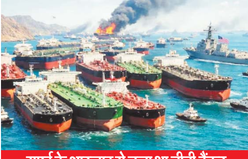
यूई के शारजाह से चला था चीनी टैंकर

चीन के जहाज का होर्मुज से दो बार लौटना दिखाता है कि वो रिस्क का आकलन कर रहा है। विश्लेषकों का कहना है कि होर्मुज स्ट्रेट में किसी भी देश के जहाजों को कोई विशेष छूट नहीं दी जा रही है। मिंग्कुन टेक्नोलॉजी के डेटा के अनुसार, 'रिच स्टार' नाम का जहाज मंगलवार सुबह करीब 2 बजे होर्मुज स्ट्रेट पार कर ओमान की खाड़ी में पहुंचा। हालांकि, दोपहर करीब 3 बजे उसने यू-टर्न लिया और वापस उसी रास्ते से लौट गया। बुधवार शाम तक ये जहाज ईरान के लारक द्वीप के दक्षिण-पश्चिम में लंगर डाले खड़ा था।