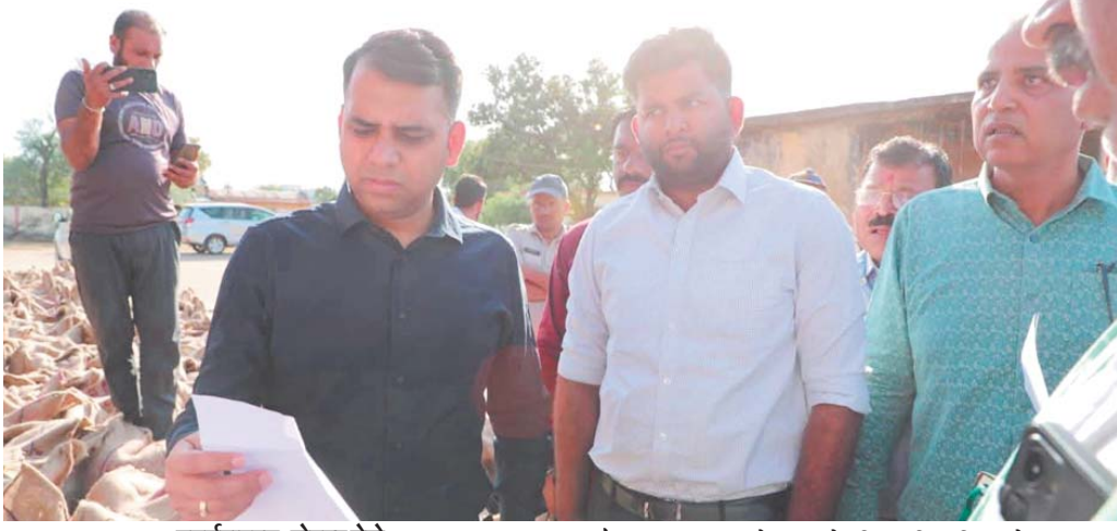
नर्मदापुरम, दोपहर मेट्रो