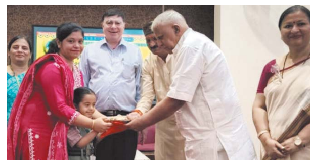
नवनिध में छात्राओं व अभिभावकों के लिए सत्र आयोजित