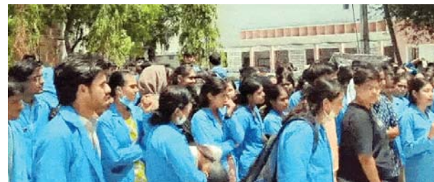
भोपाल. दोपहर मेट्रो।

भोपाल के गांधी मेडिकल कॉलेज में पैरामेडिकल छात्रों की छात्रवृत्ति को लेकर विवाद गहरा गया है। सत्र 2023-24 और 2024-25 के 400 छात्र फॉर्म भरने की अनुमति नहीं मिलने से प्रेशन है। समस्या का समाधान नहीं होने पर छात्रों ने आज से हड़ताल पर रहेगे। छात्रों ने कॉलेज के एडमिन