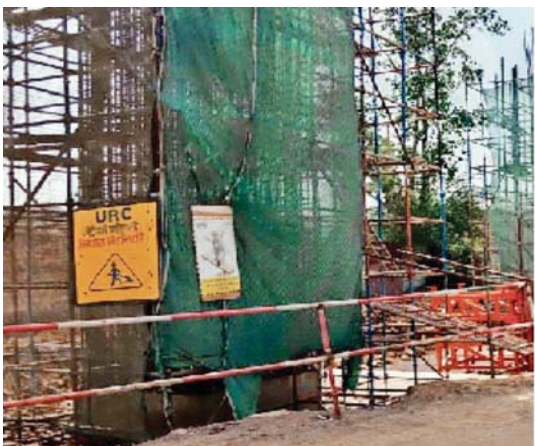
भोपाल. दोपहर मेट्रो।

मेट्रो की ऑरेंज लाइन के विस्तार का काम अब जमीनी स्तर पर दिखने लगा है। पिछले काफी समय से बंद पड़े पुल बोगदा मार्ग पर अब मेट्रो के पिलरों को आकार देने का काम शुरू हो गया है। यहाँ पहाड़ी क्षेत्र की ढलान पर खुदाई पूरी होने के बाद