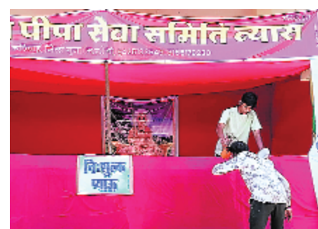
एनजीओ व स्वयंसेवी संस्थाओं ने