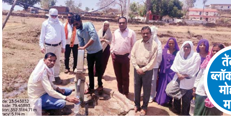
तेंदूखेड़ा ब्लॉक के गांव मोहरा का मामला

ब्लॉक के ग्राम मोहरा में शुक्रवार रात करीब 25 ग्रामीण अचानक बीमार पड़ गए। उन्हें उल्टी और दस्त की शिकायत हुई, जिसके बाद तत्काल इलाज के लिए तेंदूखेड़ा स्वास्थ्य केंद्र ले लाया गया। कुछ लोगों की हालत गंभीर होने पर उन्हें जिला अस्पताल रेफर किया गया है। ग्रामीणों के अनुसार वो गांव में एक मंदिर के पास आयोजित भंडारे शामिल हुए थे जहां उन्होंने भोजन किया था। इसके बाद शाम 6 बजे से उनकी तबीयत बिगड़ने लगी और उल्टी-दस्त की समस्या शुरू हो गई घटना की जानकारी मिलते ही स्वास्थ्य विभाग की एक टीम शनिवार की सुबह मोहरा ग्राम पहुंची। टीम ने ग्रामीणों से बातचीत कर मामले की जांच कर रही है ताकि बीमारी के सही कारण का पता लगाया जा सके साथ ही स्वास्थ्य विभाग का अमला घर घर पहुंचकर लोगों की जांच कर रहा है।