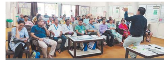
दस दिवसीय रोग निवारण एवं प्रशिक्षण शिविर

एक मई के उपरांत घर प्रणाली सर्वे के लिए पहुंचेगा। तो इस आईडी को प्रणाली को उपलब्ध कराना आवश्यक होगा। इसके बाद प्रणाली स्वगणना की जानकारी की पुष्टि कर उसे फ्रीज कर लेगा।