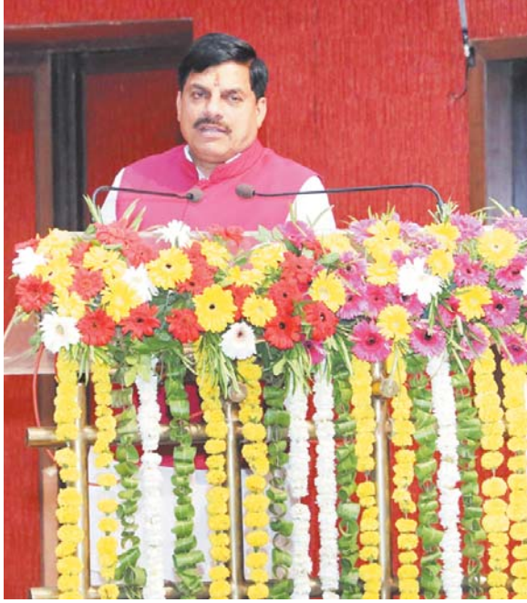
मुख्यमंत्री डॉ. मोहन यादव ने मध्यप्रदेश विधानसभा द्वारा वर्ष 2026-27 के लिए नवगठित सभा समितियों की संयुक्त बैठक को विधानसभा में संबोधित किया।