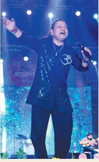
सागर।

खुरई के किला मैदान में डोहेला महोत्सव आतिशबाजी के साथ शुरू हो गया। पहले दिन प्रसिद्ध गायक पद्मश्री कैलाश खेर की प्रस्तुति ने किला मैदान में मौजूद दर्शकों को झुमने पर मजबूर कर दिया। पूर्व गृहमंत्री, खुरई विधायक छ भूपेन्द्र सिंह द्वारा आयोजित इस महोत्सव में सिंह ने कहा कि खुरई का किला खंडहर बन चुका था हमने इसे इंडन गार्डन स्टेडियम की तरह हरी घास और सौंदर्य से भर दिया है। आज यह बड़ा पर्यटन स्थल है, खुरई की सांस्कृतिक और खेल गतिविधियों का केंद्र बन गया जिससे सैकड़ों परिवारों की आर्थिक व्यवस्था सुनिश्चित होती है। डोहेला महोत्सव ने मुंबई और खुरई तथा अमीरी और गरीबी के बीच की दूरी मिटा दी है। जिन बड़े कलाकारों को देखने लोग मुंबई जाते थे उन्हें खुरई के किला डोहेला में आम लोगों के बीच लाइव परफार्मेंस के