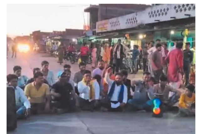
कटनी। दोपहर मेट्रो

जिले के बड़वारा मुख्यालय में मंदिर के पास संचालित शराब दुकान को हटाने की मांग को लेकर ग्रामीणों ने विरोध प्रदर्शन किया। बड़ी संख्या में ग्रामीण देर शाम बड़वारा के मशीन चौक पर एकत्रित हुए और सड़क