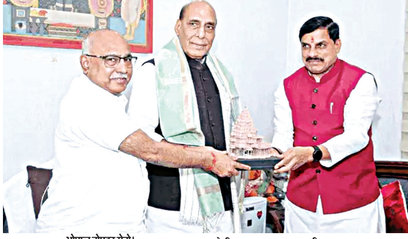
भोपाल दोपहर मेट्रो।

मप्र भाजपा की नयी और आंतरिक जमावट की कवायद शुरू हो गई है। नए प्रदेश अध्यक्ष हेमंत खंडेलवाल को साथ लेकर सीएम मोहन यादव ने दिल्ली में मंगलवार को कई नेताओं से मुलाकात की है। यादव ने प्रदेश अध्यक्ष खंडेलवाल के साथ केन्द्रीय उपभोक्ता मामलों और नवकरणीय ऊर्जा मंत्री प्रहलाद पटेल, सूचना एवं प्रसारण राज्य मंत्री एल मुकुगन, केन्द्रीय रक्षा मंत्री राजनाथ सिंह से मुलाकात की इसके बाद वे भाजपा अध्यक्ष जेपी नड्डा के निवास पर पहुंचे। यादव और हेमंत खंडेलवाल ने उनसे करीब आधा घंटे चर्चा की। माना जा रहा है कि इस चर्चा का मसकद खंडेलवाल की नई टीम का बनावट था। खंडेलवाल ने प्रदेश अध्यक्ष की जिम्मेदारी मिलने पर राष्ट्रीय अध्यक्ष