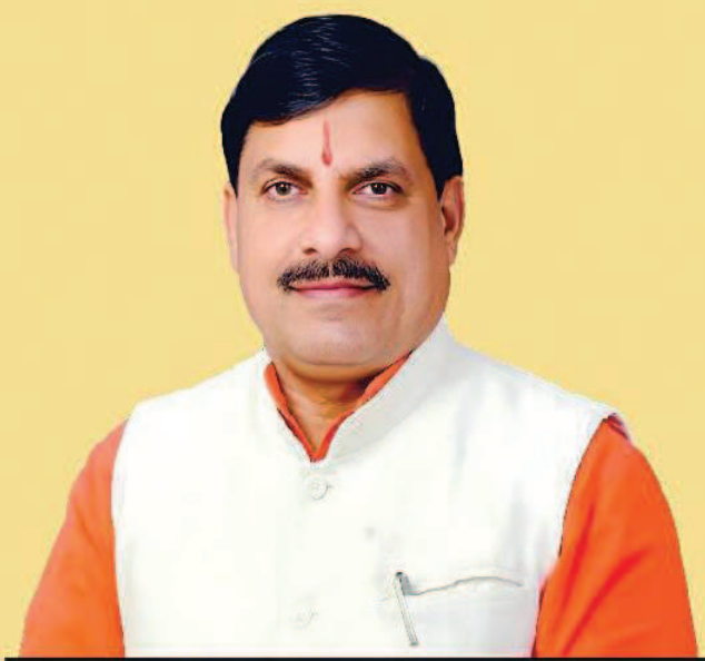
डॉ. मोहन यादव, मुख्यमंत्री