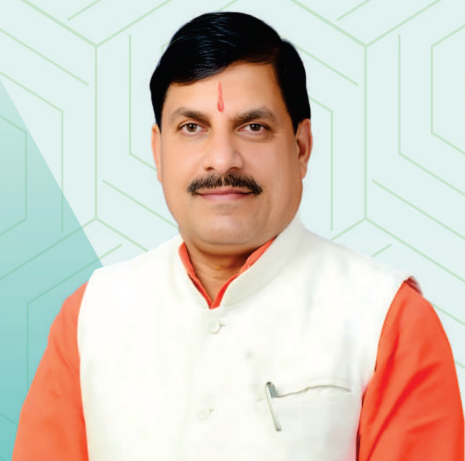
डॉ. मोहन यादव मुख्यमंत्री