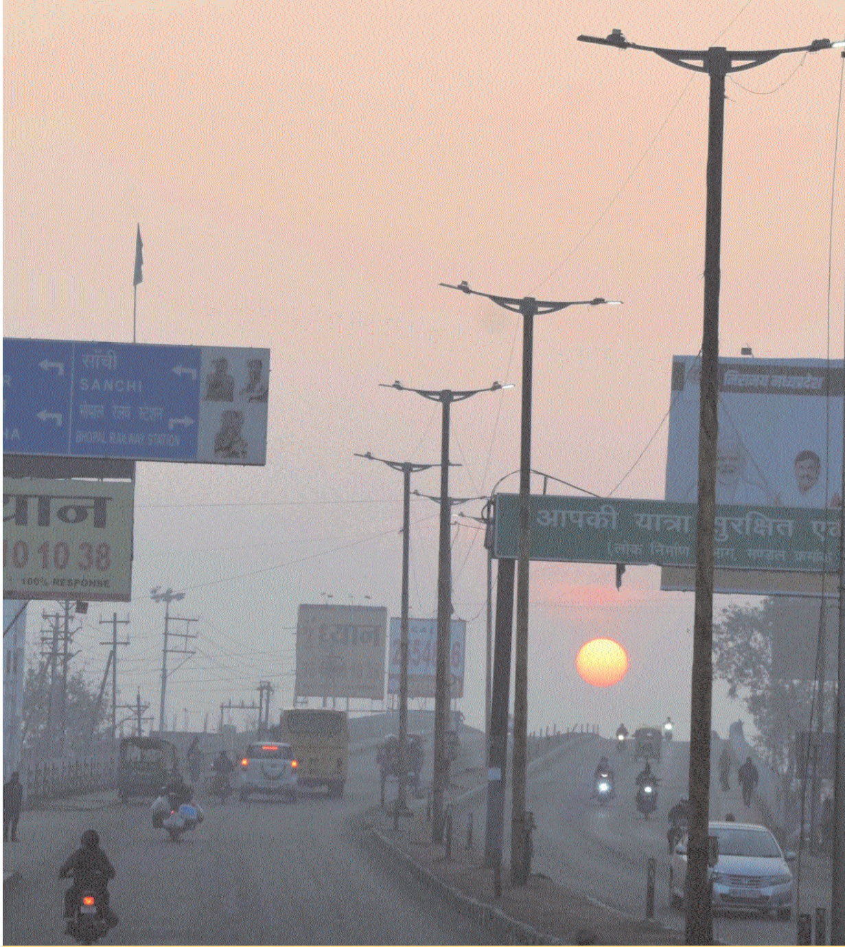
भोपाल. दोपहर मेट्रो। बादलों के कारण शहर के न्यूनतम तापमान में एक ही दिन में साढ़े पांच डिग्री की बढ़ोतरी हो गई। शहर में पूरे दिन बादलों की स्थिति रही, इस दौरान सुबह ठंडक रही, लेकिन दोपहर बाद हवा का रुख बदले ही सदी से थोड़ी राहत मिली। गुरुवार को न्यूनतम तापमान 10.8 डिग्री पर पहुंच गया।