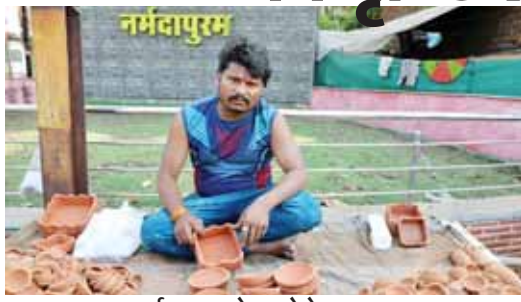
नर्मदापुरम, दोपहर मेट्रो।

नर्मदापुरम में स्थानीय दुकानदार मिट्टी के दीपक बेच रहे हैं