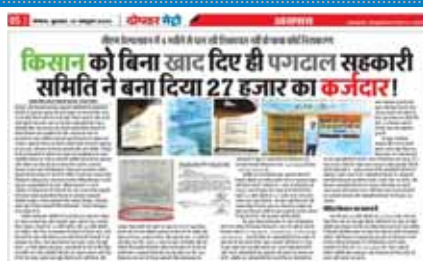
अधिकारियों ने इस मामले में निराकरण के लिए सिवनी मालवा और शिवपुर शाखा प्रबंधक को निर्देशित किया गया लेकिन उन्होंने इस पर कोई

विगत दिनों ग्राम पगढाल की सेवा सहकारी समिति के द्वारा रावन पीपल के किसान को बगैर खाद लिए 27000 रुपए का कर्जदार बना दिया था। पीड़ित किसान विगत 2 सालों से अपने आप को निर्दोष साबित करने के लिए जगह-जगह शिकायत करने पर मजबूर हो गया और अपने आपको 20 बोरी डीएपी जो उसने ली ही नहीं उसे कर्ज से मुक्ति दिलाने के लिए जिला प्रशासन से लेकर मुख्यमंत्री हेल्पलाइन तक में शिकायत करी गई शिकायत के निराकरण के लिए 10 अक्टूबर को भी जिला सहकारी बैंक के जिला