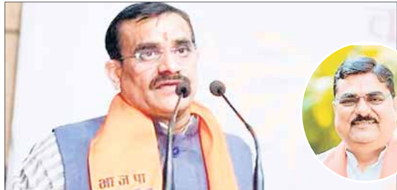
भोपाल.