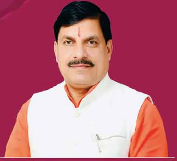
डॉ. मोहन यादव, मुख्यमंत्री