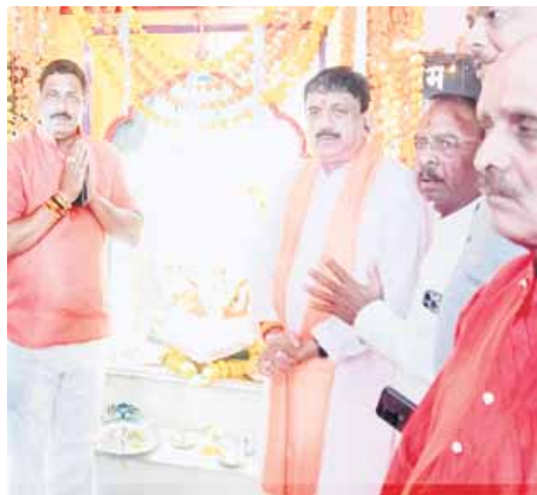
भोपाल। सकल वाल्मीकि पंचायत वृत्त एवं उत्सव समिति द्वारा महाकाव्य रामायण के रचयिता महर्षि वाल्मीकि का प्रकाश प्रकटोत्सव चौकी इमामबाड़ा स्थित वाल्मीकि मंदिर पर भोपाल सांसद आलोक शर्मा ने पूजा आर्चना की।

आल इंडिया काउंसिल फार टेक्निकल एजुकेशन ने इंजीनियरिंग कॉलेजों में प्रवेश के लिए रिवाइज्ड कैलेंडर जारी किया था। इसके आधार पर तकनीकी शिक्षा विभाग ने कॉलेज लेवल काउंसलिंग की प्रक्रिया शुरू की है। इसके तहत तीन चरण तय किए हैं। इसके तहत ऐसे विद्यार्थी जो अभी भी पंजीयन नहीं करा पाए हैं वे इस चरण में बुधवार तक पंजीयन कराकर अपनी पसंद के कॉलेज में प्रवेश ले सकते हैं। इसके तहत प्रवेश की आखिरी तारीख 23 अक्टूबर की है। करने के लिए 325 विद्यार्थियों ने पंजीयन कराया है।