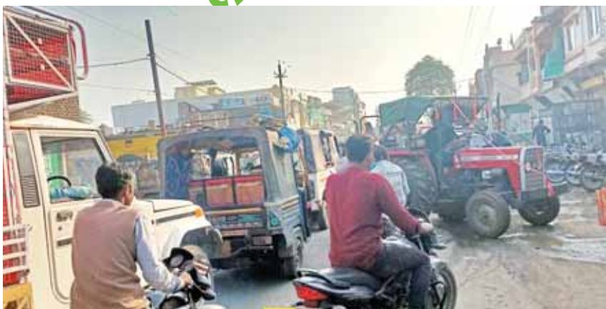
सिरोंज, दोपहर मेट्रो।

सोमवार को तीन दिनों की अवकाश के बाद कृषि उपज मंडी में कामकाज हुआ एक दिन पहले से ही बड़ी संख्या में किसान अपनी उपज को विक्रय करने के लिए लेकर आ गए थे। क्योंकि इस समय किसानों को अगली फसल की बोनी की तैयारी करने के लिए खाद बीज से लेकर डीजे आदि की आवश्यकता हो रही है। इस दौरान ल्योहार के चलते तीन दिनों तक मंडी में कामकाज नहीं होने से