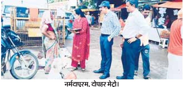
नर्मदापुरम, दोपहर मेट्रो।

मध्य प्रदेश शासन सामाजिक न्याय एवं दिव्यांगजन सशक्तिकरण विभाग के दिशा निर्देश अनुसार प्रदेश में भीख मांगने वाले व्यक्तियों अथवा भिक्षावृत्ति में लिप्त व्यक्तियों को समाज की मुख्य धारा में जोड़ने हेतु सर्वेक्षण/ पहचान, मोबिलाइजेशन, पुनर्वास और आजीविका तथा भिक्षा मांगने के लिए व्यक्तियों को नियोजित करने या उनसे भिक्षा मांगने के प्रयोजन हेतु उपयोग करने वाले व्यक्ति पर कार्रवाई करते हुए 'भिक्षावृत्ति मुक्त मध्य प्रदेश' किया जाना है।