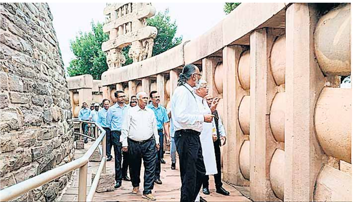
रायसेन, दोपहर मेट्रो।

केंद्रीय पर्यटन मंत्री गजेन्द्र सिंह शेखावत शुक्रवार को एक दिवसीय भ्रमण पर रायसेन जिले में साँची स्थित विश्व धरोहर बौद्ध स्तूप पहुंचे। केंद्रीय मंत्री श्री शेखावत का भारतीय संस्कृति के अनुरूप तिलक लगाकर और पुष्प गुच्छ भेंट कर स्वागत किया गया। केंद्रीय मंत्री श्री शेखावत ने बौद्ध स्तूपों सहित अन्य धरोहरों को देखा तथा उनकी सुंदरता, बनावट शैली देखकर मंत्रमुग्ध हो गए। बौद्ध स्तूपों के साथ ही यहां के नैसर्गिक सौंदर्य ने भी उन्हें अपनी ओर आकर्षित किया। इस दौरान भारतीय पुरातत्व सर्वेक्षण विभाग के अधिकारियों द्वारा भगवान बौद्ध की शिक्षाओं और सम्राट अशोक के संदेशों से अवगत करवाया। उन्हें साँची स्तूपों की