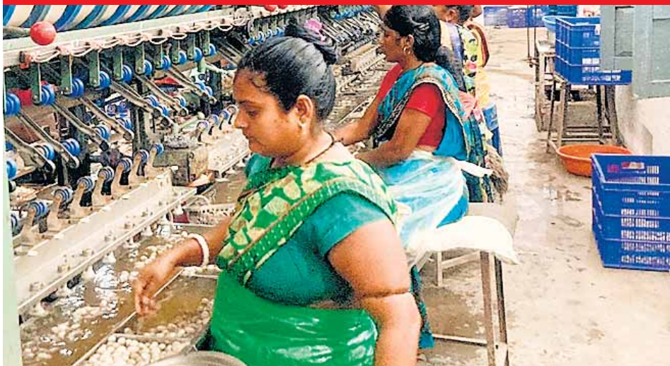
नर्मदापुरम, दोपहर मेट्रो।

प्रदेश में नर्मदापुरम संभाग के नर्मदा पुरम एवं बैतूल जिले रेशम उत्पादन के क्षेत्र में अग्रणी जिले हैं। नर्मदापुरम जिले के मालाखेड़ी रेशम परिसर में प्रदेश का रेशम वस्त्रों का सबसे बड़ा शोरूम प्राकृत संचालित किया जाता है। जिसमें नवीन वस्त्रों की श्रृंखला में नवीन बाघ प्रिंट, कलमकारी प्रिंट पचेड़ी प्रिंट, बनारसी तथा जामदानी के शुद्ध रेशमी वस्त्र विक्रय एवं प्रदर्शन के लिए उपलब्ध हैं। साथ ही उक्त परिसर में ही मलबरी रेशम धागाकरण, टसर धागाकरण, मूंगा रेशम धागाकरण व रेशम वस्त्र बुनाई का कार्य भी किया जाता है। रेशम परिसर मालाखेड़ी में रेशम उत्पादन प्रक्रिया से जोड़कर लगभग 80 महिलाओं को रोजगार भी दिया जा रहा है।