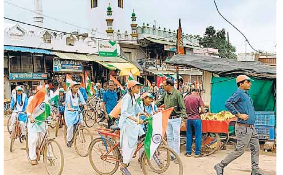
नर्मदापुरम, दोपहर मेट्रो।

शासन के निर्देशानुसार 9 अगस्त से 15 अगस्त की अवधि में हर घर तिरंगा अभियान का क्रियान्वयन किया जा रहा है, कलेक्टर सोनिया मीना के निर्देश पर इस अभियान का मुख्य उद्देश्य देशवासियों में तिरंगा के बारे में जागरूकता उत्पन्न कर देश भक्ति की भावना जागृत करना है। अभियान के तहत नगर परिषद बनखेड़ी द्वारा 12 अगस्त 2024 को साईकिल रैली का आयोजन किया गया।