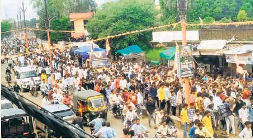
सिवनी मालवा, दोपहर मेट्रो।

श्रावण मास के चौथे सोमवार को भगवान शिव की नगरी कहलाने वाली सिवनी मालवा में प्रतिवर्ष अनुसार इस वर्ष भी सिवनी मालवा नगर और ग्रामीण क्षेत्र से हजारों की संख्याओं में युवाओं द्वारा उज्जैन महाकालेश्वर के राजा अधिराज की जो शाही सवारी उज्जैन में निकाली जाती है उसी की तर्ज पर सिवनी मालवा नगर में भी सीताराम गुप द्वारा भगवान शंकर की शाही सवारी