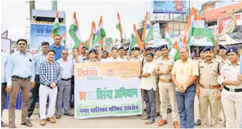
रायसेन, दोपहर मेट्रो।

हर घर तिरंगा अभियान के तहत आज रायसेन नगर में तीनों मुख्य मार्गों से एक साथ प्रभात फेरी निकाली गई जिसका समापन भोपाल-सागर तिराहे पर हुआ। प्रभात फेरी में 25 स्कूलों के 1500 से अधिक विद्यार्थियों सहित अधिकारियों-कर्मचारियों ने सहभागिता कर नागरिकों को अपने घरों पर तिरंगा फहराने के लिए प्रेरित किया। प्रभात फेरी के समापन के दौरान सभी को हर घर तिरंगा अभियान में सहभागिता कर राष्ट्रीय ध्वज तिरंगा फहराने, स्वतंत्रता सेनानियों और वीर सपूतों की भावना का सम्मान करने तथा भारत के विकास और प्रगति के प्रति स्वयं को समर्पित करने की प्रतिज्ञा दिलाई गई।