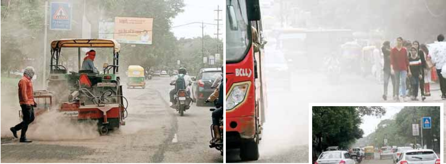
राजधानी लिंक रोड पर धूल से नहीं मिल रही निजात। सड़क किनारे चलना हो रहा मुश्किल।

राजधानी में लगभग सभी मुख्य मार्ग की हालत खराब, बारिश से खुली घटिया निर्माण की कलई