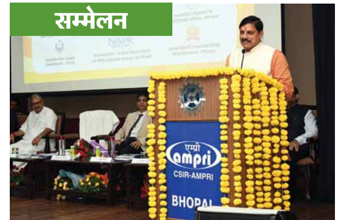
भोपाल। मुख्यमंत्री डॉ. मोहन यादव ने सी एसआईआर-प्रगत पदार्थ तथा प्रक्रम अनुसंधान संस्थान द्वारा आयोजित राष्ट्रीय हिंदी विज्ञान सम्मेलन का शुभारंभ किया।

खासकर रायसेन जिले की स्थिति बिजली को लेकर बेहाल है। ग्रामीण क्षेत्रों में सड़कें नहीं होने से, कच्ची सड़कों और घरों के आसपास बड़ी मात्रा में पानी भरा रहता है, लेकिन बिजली विभाग बेफिक्र होकर दफ्तरों में बैठे गपशप लड़ाते रहते हैं। पटवारी ने कहा कि प्रदेश में 15 महीने की कांग्रेस सरकार ने बिजली उपभोक्तियों को 100 रुपये में 100 यूनिट बिजली मुहैया करायी थी। भाजपा सरकार आते ही बिजली के भारी भरकम बिल थोपे जाने लगे। उन्होंने कहा कि सरकार और सरकार से जुड़े लोग केवल अपने स्वार्थ और इवेंट की राजनीति में व्यस्त रहते हैं, उन्हें जनता की भावनाओं से कोई सरोकार नहीं है।