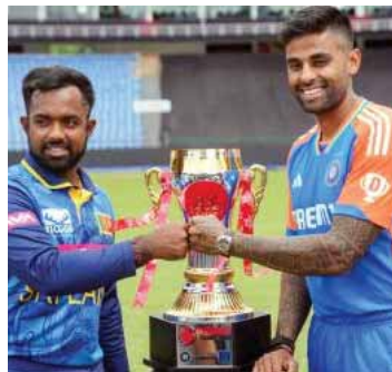
गंभीर कोच के तौर पर भी टीम इंडिया को नई ऊंचाइयों पर ले जाने की कोशिश में है। लेकिन उनके सामने चुनौती कम नहीं है।

इसी के साथ भारतीय क्रिकेट के गंभीर युग की शुरुआत हो रही है जिसका पहला पड़ाव श्रीलंका है। अपनी बल्लेबाजी से टीम को दो-दो बार विश्व चैंपियन बनाने वाले