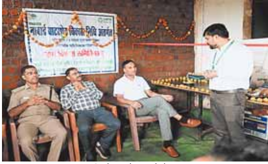
सिरोंज, दोपहर मेट्रो।

देखा उद्यान खेती, महिला किसान से खेती के बारे में जाना