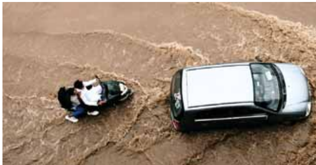
बारिश से पानी से डूबी एक सड़क।

तक 1664.50 फीट पानी है। फुल टैंक लेवल 1666.80 फीट है। भोपाल में आज सुबह से ही तेज बारिश का दौर है। ऐसे में तालाब में शाम तक पानी 65 तक भी पहुँच सकता है। भोपाल में दो दिन में तेज बारिश के चलते करीब दो इंच पानी गिर चुका है। इससे कई जगहों पर जलभराव की स्थिति भी बन गई है। लगातार बारिश होने की वजह से दिन-रात के तापमान में भी गिरावट हुई है। कल ही अधिकतम तापमान 25.9 डिग्री रहा।