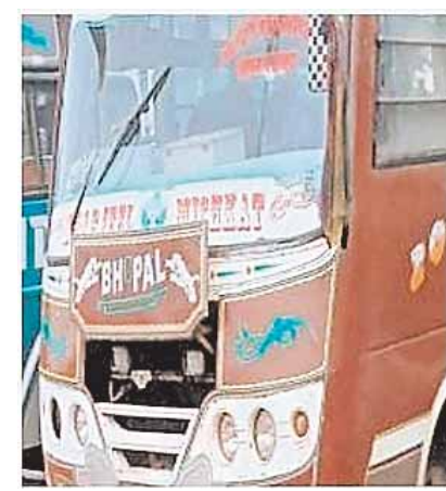
के पालन की दिशा में आज तक कोई ठोस कदम नहीं उठाए जा सका है। वहीं सड़क पर फरटा भर रहे अधिकांश

लटेरी में अबतक इन खटारा बसों की सघन जांच नहीं हुई है नतीजा, बिना रोक-टोक के ऐसी गाड़ियों का परिचालन धड़ले से हो रहा है यहां तक की अन्य राज्यों में अनफिट घोषित गाड़ियों को लोग सस्ते में खरीद कर यहां चला रहे हैं। यहीं गाड़ियां लोगों के लिए जानलेवा साबित हो रही हैं। यही कारण है कि सड़क दुर्घटना में खटारा बसों का काफी योगदान माना जाता है रोक के बावजूद सड़कों पर खटारा बसे फरटा भर रहे ही हैं सबसे बुरा हाल तो लटेरी बसों का है जो की 25 सीटर में 40 सवारी और 52 सीटर में 70 सवारी दूस दूस कर भर देते हैं लटेरी से अन्य जगह जाती हैं सरकार के काफी सुधार के बाद भी खटारा है, जो सड़कों पर दौड़ रही हैं। इसे देखनेवाला कोई नहीं है। सड़क हादसों पर सरकार से लेकर विभाग तक हाय-तौबा करता है। लेकिन, यातायात नियमों