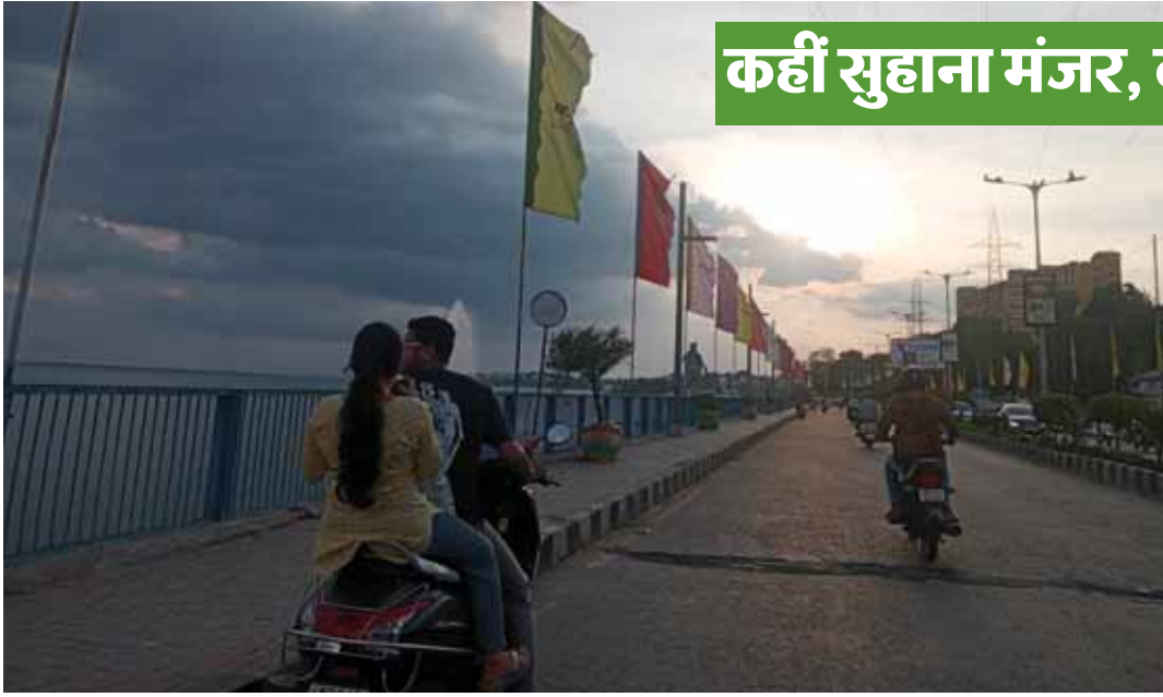
भोपाल। राजधानी में हो रही बारिश के बाद मौसम सुहाना हो गया है। दृश्य वीआईपी रोड का।