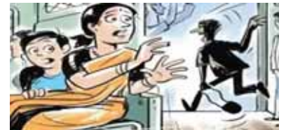
भोपाल, दोपहर मेट्रो।

चलती ट्रेनों में भी लगातार हो रही चोरी की वारदातें