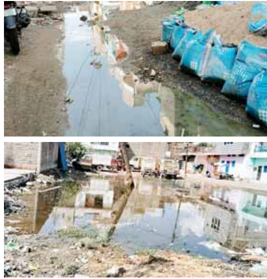
शिव नगर व कल्याण नगर में मकान के सामने गंदा पानी कचरा।