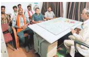
सिरोंज, दोपहर मेट्रो।

कांग्रेस ने किया प्रदर्शन, मंडी में भेजा आवेदन पुलिस ने लौटाया