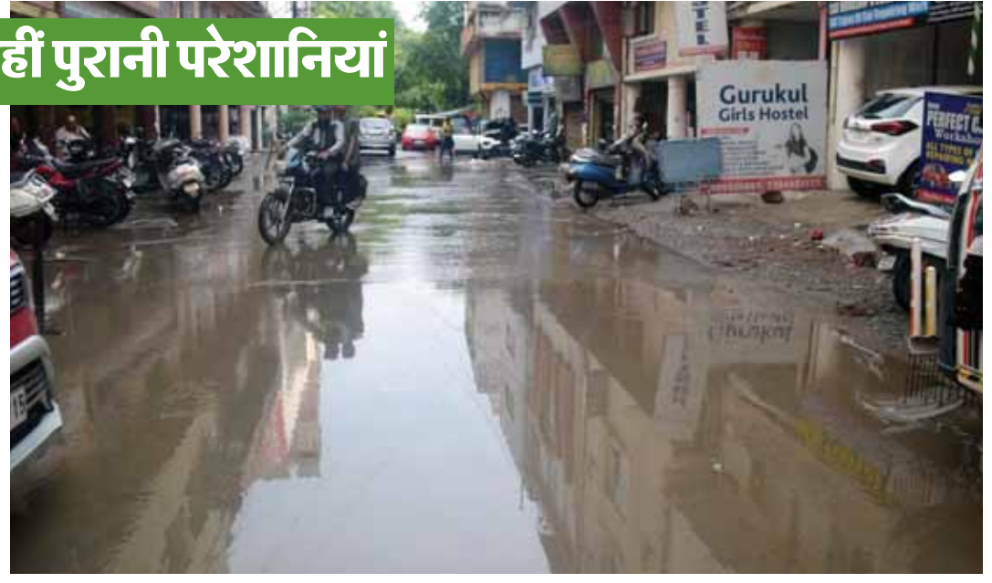
भोपाल। शहर में हुई बारिश के बाद सड़कों पर पानी भरा है। जिससे लोगों को आवागमन में परेशानी हो रही है।