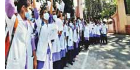
(आईएनसी) एक्ट के अनुरूप राज्य सरकार अपने नियम बनाएगी। इन्हीं नियमों के अनुरूप नर्सिंग कॉलेजों की मान्यता जारी की जाएगी।

नर्सिंग कॉलेजों में फर्जीवाड़े को रोकने के लिए शासन ने सख्त रुख अपनाया है। अब नियामक आयोग बनाने को लेकर तैयारियां शुरू हो गई हैं। बताया जा रहा है कि आईएनसी ने एक्ट तैयार कर लिया है। इसके अनुरूप में ही प्रदेश में नियामक आयोग का गठन किया जाएगा। स्वास्थ्य एवं चिकित्सा शिक्षा विभाग द्वारा तैयार ड्राफ्ट पर परीक्षण के बाद सामान्य प्रशासन विभाग और विधि विभाग राय दी जाएगी। जिसके इसे अंतिम रूप दिया जाएगा। बताया जा रहा है कि एक जुलाई से शुरू होने जा रहे मानसून सत्र के दौरान ही इसे कैबिनेट में प्रस्तुत करने की तैयारी है। कैबिनेट से स्वीकृति के बाद केंद्र के इंडियन नर्सिंग काउंसिल