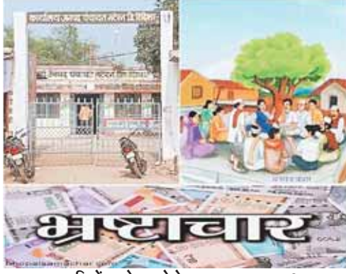
सिरोंज, दोपहर मेट्रो।

ग्राम पंचायत राय खेड़ी में सरपंच सचिव द्वारा विभिन्न मर्दों से कराए गए लाखों के निर्माण कार्यों की हो निष्पक्ष जांच की ग्रामीणों ने की मांग