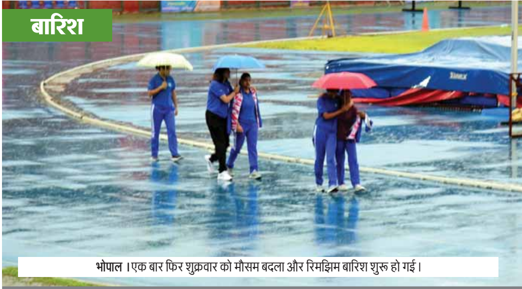
भोपाल। एक बार फिर शुक्रवार को मौसम बदला और रिमझिम बारिश शुरू हो गई।