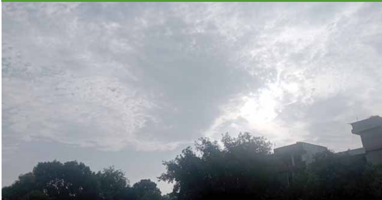
भोपाल। ग्री-मानसून एक्टिविटी के चलते इन दिनों मौसम का बार-बार मिजाज बदल रहा है। आसमान पर बादल छाए रहे।