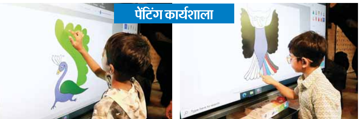
भोपाल के जनजाति संग्रहालय में पेंटिंग कार्यशाला का आयोजन किया गया जिसमें बच्चे पेंटिंग देखते हुए।