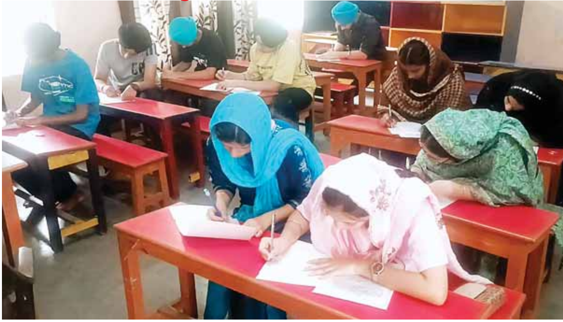
पिपलानी गुरुद्वारे में गुरु शिक्षण कैंप में भाग लेने के लिए बच्चे आज परीक्षा होते हुए।