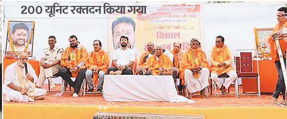
200 यूनिट रक्तदान किया गया

शनिवार को पूर्व मंत्री स्व. लक्ष्मीकांत शर्मा की तृतीय पुण्यतिथि पर राजीव गांधी चिकित्सालय में रक्तदान शिविर का आयोजन किया गया जिसमें रक्तदान करने के लिए लोगों की भीड़ लगी रही युवक युवतियों ने भी रक्तदान किया वहीं रक्तदान करने वाले सभी लोगों का क्षेत्रीय विधायक उमाकांत शर्मा ने सम्मान भी किया और कहा कि लक्ष्मीकांत शर्मा से प्रेम रखने वाली बालिकाएं भी उत्साह के साथ रक्तदान करने के लिए आए हैं यह हमारे लिए गौरव की बात है। रक्तदान शिविर का आयोजन स्व. लक्ष्मीकांत शर्मा स्मृति लोक कल्याण न्यास के तत्वाधान में किया। पूर्व मंत्री से प्रेम के चलते लोग हाई टेपरचर में भी उत्साह के साथ रक्तदान करने के लिए पहुंचे यहां तो ब्लड बैंक नहीं है इसीलिए जिले से आई ब्लड बैंक यूनिट में जमा किया जा रहा था। इसका उपयोग जरूरतमंद मरीजों के लिए किया जाएगा क्योंकि ब्लड के अभाव में कई बार आदमी की मौत हो जाती है इसलिए यह सबसे ज्यादा पुण्य का काम किया गया है।