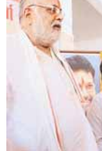
रक्तदान का शुभारंभ