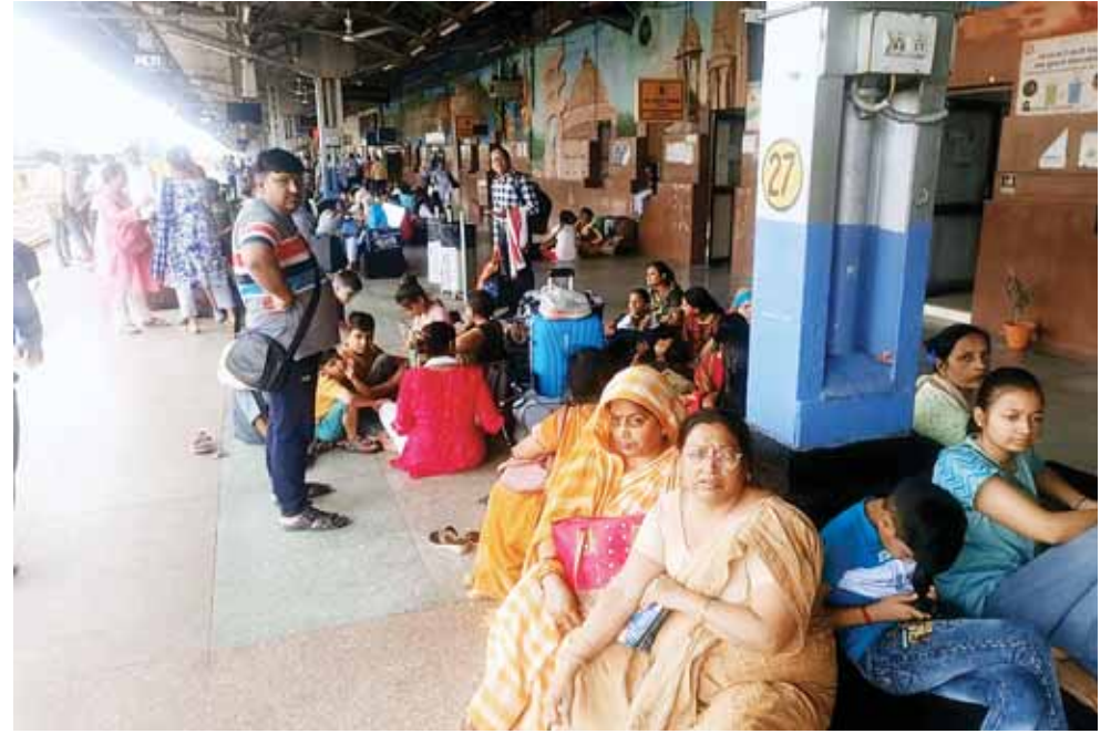
मौसम से बदलाव के कारण शनिवार को राजधानी में बूंदबादी के चलते बड़ी उमस ने लोगों को गर्मी से परेशान किया।