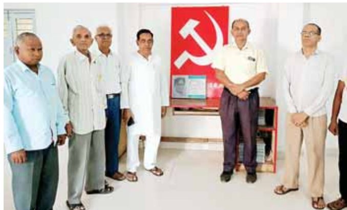
भारतीय कम्युनिस्ट पार्टी के तमिलनाडु से सांसद कॉमरेड एम सेल्वाराज और मप्र भाकपा सदस्य कॉमरेड नरेन्द्र पाण्डे को पार्टी के राज्य कार्यालय शाकिर सदन में श्रद्धांजलि अर्पित की गई।

- उज्जैन के मध्य आंशिक निरस्त रहेगी। 2. ट्रेन नंबर 19324/19323 भोपाल - डॉ. आंबेडकर नगर - भोपाल एक्सप्रेस प्रतिदिन 31 मई 2024 तक दोनों दिशाओं में इंदौर तक जाएगी अर्थात् इंदौर - डॉ. आंबेडकर नगर - इंदौर के मध्य आंशिक निरस्त रहेगी। 3. ट्रेन नंबर 11703 रीवा - डॉ. आंबेडकर नगर एक्सप्रेस 16, 19, 21, 23, 26, 28 एवं 30 मई को व ट्रेन नंबर 11704 डॉ. आंबेडकर नगर - रीवा एक्सप्रेस दिनांक 17, 20, 22, 24, 27, 29 एवं 31 मई को दोनों दिशाओं में उज्जैन तक जाएगी अर्थात् उज्जैन - डॉ. आंबेडकर नगर - उज्जैन के मध्य आंशिक निरस्त रहेगी।