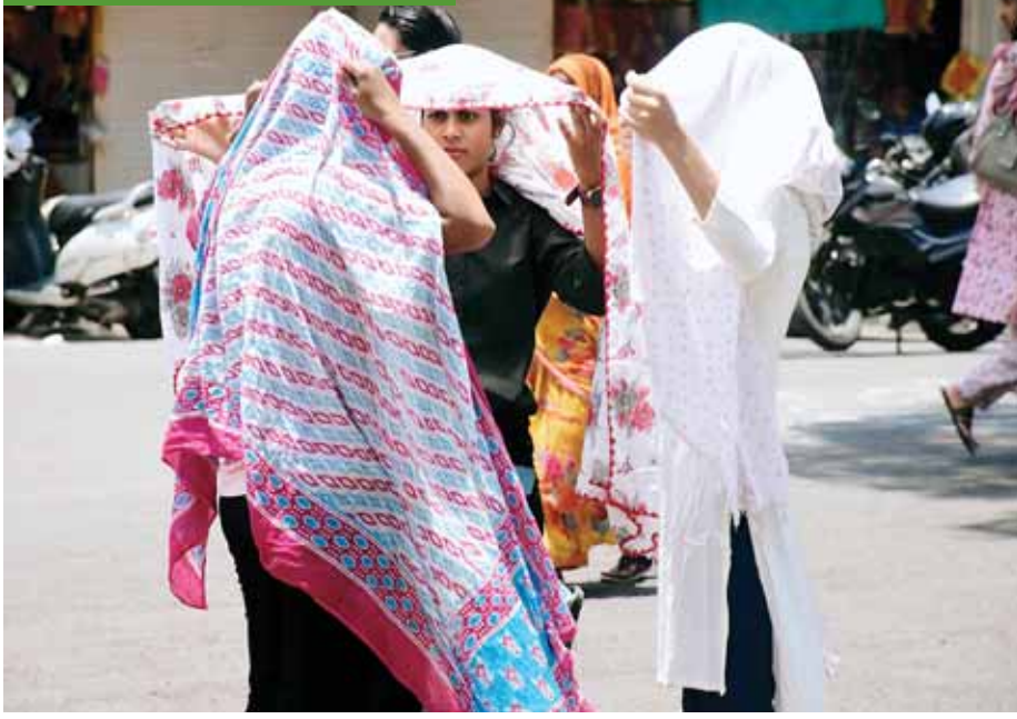
उफ... यह तेज धूप... भोपाल में गर्मी के पारे ने फिर अपना असर दिखाना शुरू कर दिया। धूप से खुद का बचाव करती युवतियां।