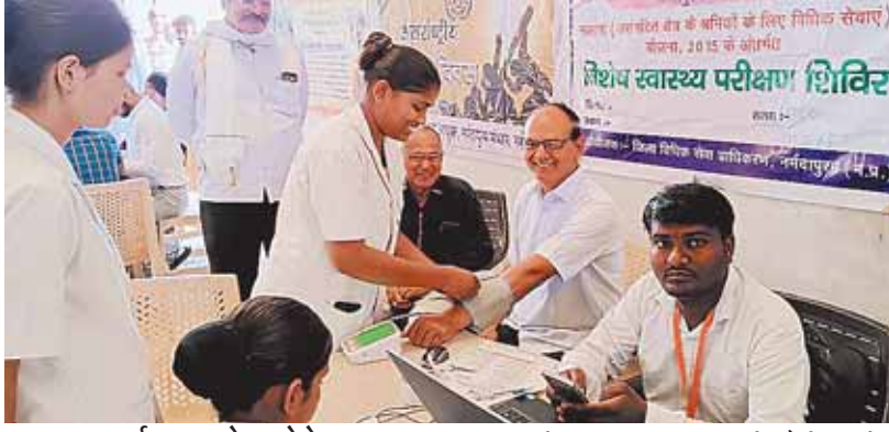
नर्मदापुरम, दोपहर मेट्रो।

उच्च न्यायालय के निर्देशन में 1 मई 2024 को मजदूर दिवस के उपलक्ष्य में जिले में 01 से 04 मई तक विधिक साक्षरता का आयोजन विधिक सेवा प्राधिकरण एवं श्रम विभाग द्वारा किया जा रहा है। इसी