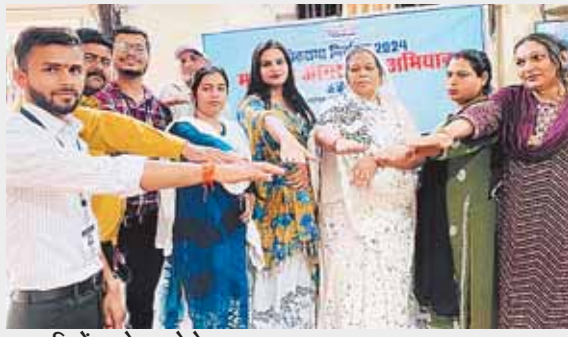
सिरोंज, दोपहर मेट्रो।

विदिशा जिले में शत-प्रतिशत मतदान हो इस हेतु जिला प्रशासन द्वारा हर स्तर पर प्रबंध सुनिश्चित किए गए हैं। 10 डेज मेगा इवेंट के अंतर्गत व्यापक स्तर पर स्वीप कार्यक्रमों का आयोजन कर जिले भर में मतदाता जागरूकता के संदेशों का प्रसारण किया जा रहा है। इसी के तहत विदिशा नगरीय क्षेत्र के थर्ड जेंडर मतदाताओं को भी मतदान के लिए अभिप्रेरित किया गया है। मतदाता जागरूकता हेतु नगर पालिका परिषद, विदिशा द्वारा