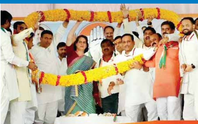
कांग्रेस महासचिव प्रियंका गांधी ने मुरैना में सभा की।