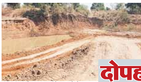
सिवनी मालवा, दोपहर मेट्रो।

लोनिवि द्वारा बनाई जा रही सड़क का कोई जवाब नहीं है विभाग के पास