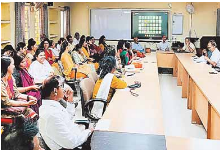
नर्मदापुरम, दोपहर मेट्रो।

नर्मदा कॉलेज में उच्च शिक्षा विभाग के अकादमिक सत्र 2024-25 की ऑनलाइन ई प्रवेश प्रक्रिया की तैयारी शुरू कर दी है। यू जी के पंजीयन और सत्यापन प्रारंभ हो