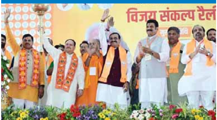
भाजपा अध्यक्ष जगतप्रकाश नड्डा ने सागर लोकसभा क्षेत्र के सिरोंज में जनसभा को संबोधित किया।