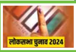
लोकसभा चुनाव 2024

पायलट राजगढ़ में- कांग्रेस महासचिव राजस्थान के पूर्व उपमुख्यमंत्री सचिन पायलट आज राजगढ़ में कांग्रेस प्रत्याशी दिग्विजय सिंह के लिये प्रचार में उतरे हैं। उन्होंने जीरापुर व ब्यावरा में जनसंपर्क किया और सभा की। इसके बाद वे ग्वालियर के डबरा पहुंचकर स्थानीय कार्यक्रम में शामिल होंगे।