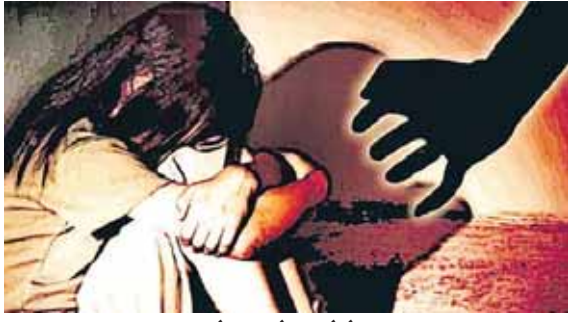
भोपाल, दोपहर मेट्रो।

हबीबगंज पुलिस ने एक नाबालिग लड़की की रिपोर्ट पर पिता के खिलाफ छेड़छाड़ और मारपीट का मामला दर्ज किया है। पुलिस के मुताबिक इलाके में रहने वाली 15 वर्षीय किशोरी नौवीं कक्षा में पढ़ती है। पिछले कुछ दिनों से पिता उसके साथ गाली-गलौज और मारपीट कर रहा था। सोमवार को पीड़िता ने विरोध किया तो पिता ने उसके साथ अश्लील हरकत कर दी। उसके बाद नाबालिग अपनी मां के साथ थाने पहुंची और पिता के खिलाफ केस दर्ज करवा दिया।