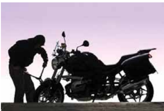
भोपाल, दोपहर मेट्रो।