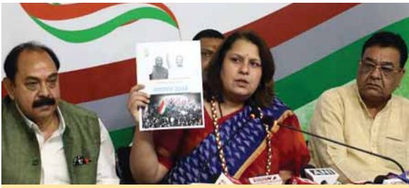
कांग्रेस नेता सुप्रिया श्रीनेता ने भोपाल में कांग्रेस के घोषणापत्र की खूबियां गिनाते हुए भाजपा पर निशाने साधे

मुलाकात के बाद उनकी अपेक्षाओं और आकांक्षाओं को दृष्टिगत रखते हुये न्याय पत्र तैयार किया गया है, जबकि भाजपा व मोदी केवल झूठे आरोपों और भ्रम फैलाकर लोगों की भावनाओं के साथ खिलवाड़ कर रहे हैं। भाजपा सरकार में महिलाओं के साथ भेदभाव किया गया है, उन्हें बहुत नुकसान पहुंचाया गया मोदी ने दो हिंदुस्तान बना दिये हैं एक अमीरों का और गरीबों का। चुनाव में 400 पार चिल्लाने वालों की हवा निकलने वाली है क्योंकि भाजपा दक्षिण में साफ हो रही है और उत्तर में हाफ हो रही है।