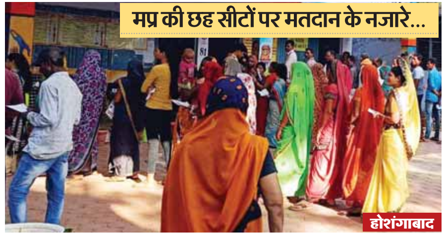
मप्र की छह सीटों पर मतदान के नजारे...