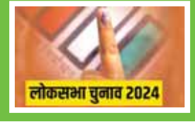
लोकसभा चुनाव 2024