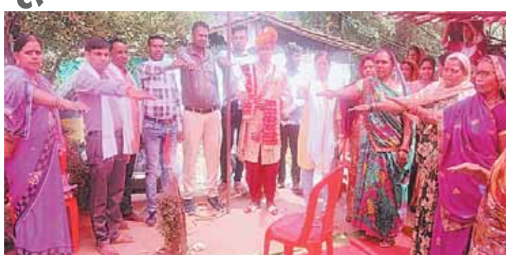
सिवनी मालवा दोपहर मेट्रो।

लोकतंत्र के इस महापर्व में मतदान करना कितना महत्वपूर्ण है जिसके लिए पूरे जिले में यह प्रयास किया जा रहा है कि अधिक से अधिक मतदान हो और हर मतदाता अपने मत का उपयोग करें जिसके लिए घर-घर शपथ दिलाई जा रही है हर घर पीले चावल रखकर मतदान की अपील की जा रही है। इसी के चलते बुधवार को महिला एवं बाल विकास विभाग के सेक्टर सतवासा के ग्राम बववाड़ा खुटवास, छारखेड़ा, हिरनखेड़ा भड़गचिकली एवं घुमडेव में नॉक द डोर द्वारा मतदाताओं को जागरूक किया। अब मतदान की उल्टी गिनती प्रारंभ होते ही कलेक्टर के निर्देशानुसार जिला सीईओ के मार्गदर्शन में मतदान केंद्र की व्यवस्था अपने मतदान जागरूकता