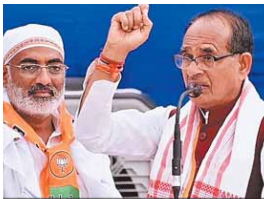
सिवनी मालवा, दोपहर मेट्रो।