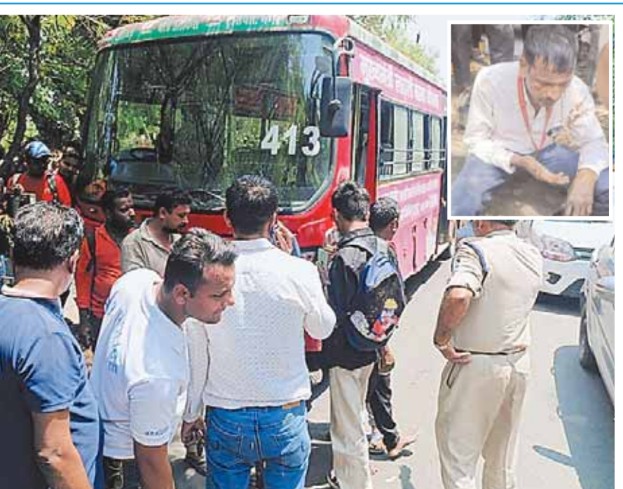
भोपाल। लिंक रोड पर आज सुबह बीआरटीएस बस व दुपहिया वाहन में भिड़ंत हुई इसमें दुपहिया सवार को चोट आई।