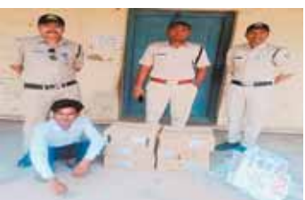
सिरोंज, दोपहर मेट्रो।