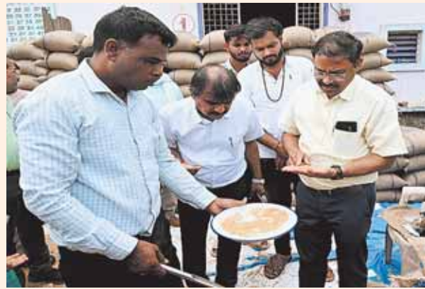
सिरोंज, दोपहर मेट्रो।

कलेक्टर ने शुक्रवार को गेहूँ उपार्जन कार्यों की अद्यतन स्थिति का जायजा लेने के उद्देश्य से तीन उपार्जन केन्द्रों का औचक निरीक्षण किया। इन केन्द्रों पर गेहूँ का परिवहन नहीं कराने के फलस्वरूप नागरिक आपूर्ति के डीएमओ को शोकाँज नोटिस जारी करने के निर्देश दिए गए हैं।