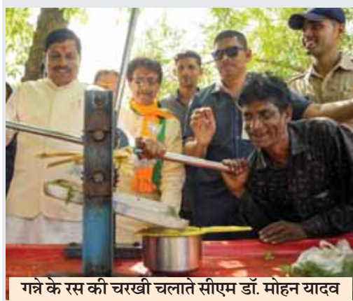
गन्ने के रस की चरखी चलाते सीएम डॉ. मोहन यादव