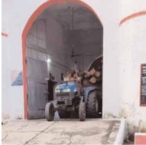
सिवनी मालवा, दोपहर मेट्रो।

उप जेल सिवनी मालवा के अंदर किस प्रकार से भ्रष्टाचार चल रहा है जिसकी एक बानगी सामने आई है जेल के अंदर हो रहे भ्रष्टाचार की बात हम नहीं कर रहे हैं यह जेल के कर्मचारीओ ने बीते रोज एक शिकायती आवेदन देकर जेलर के ऊपर गंभीर आरोप लगाते हुए निष्पक्ष जांच की मांग की है। जेल कर्मचारियों ने जेल महानिदेशक मप्र शासन भोपाल के नाम का ज्ञापन अनुविभागीय अधिकारी सिवनी मालवा को सोफा ज्ञापन में बताया गया कि सहायक अधीक्षक सिवनी मालवा जेल द्वारा अपने पद का दुरुपयोग कर किस प्रकार भ्रष्टाचार किया जा रहा है। उनके द्वारा ईद के त्यौहार जैसे विशेष सतर्कता दिवस पर बिना अनुमति के मुख्यालय छोड़ा गया एवं कर्मचारियों पर दबाव बनाकर फर्जी आमद वापसी करावयी गईं जोकि जेल गेट पर लगे सीसीटीवी कैमरे कि रिकॉर्डिंग में स्पष्ट रूप से देखा जा सकता है। जबकि कलेक्टर एवं जेल अधीक्षक नर्मदापुरम द्वारा प्रदेश में आचार संहिता लागू होने कि दशा में विशेष आदेश जारी किए गए है, कोई भी अपना मुख्यालय ना छोड़े जिसका सहायक जेल अधीक्षक द्वारा स्पष्ट उलंघन किया गया। जेल में बंदियों ओर हवालाती कि मुलाकात देने पर प्रति मुलाकातियो से प्रति व्यक्ति 200 रुपए की मांग कर मुलाकात कि जाती है एवं विभिन्न प्रकार का सामान जैसे कि खाने का तेल, गेहू चवाल, दाल, शक्कर, साग-सब्जियां मांगी जाती है। जोकि सहायक अधीक्षक कार्यालय के सामने वाले गेट से जेल में अन्दर की जाती है।