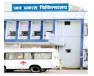
संक्रमित व्यक्ति से वायरल रोग से फैलता है

राजधानी के जेपी अस्पताल में अब वायरल रोगियों को मास्क अनिवार्य होगा। खांसी, जुकाम, बुखार, गले में खराश, सीने में जलन जैसे लक्षणों के साथ पहुंचने वाले मरीजों को पंजीयन के दौरान ही मास्क दिया जाएगा। अगर इसके बाद भी मरीज ने मास्क नहीं पहना तो उसे इलाज नहीं मिलेगा। यह नियम सोमवार से अस्पताल में लागू हो जाएगा। बता दें कि इस पहल से कोरोना वायरस का लेना देना नहीं है। कोरोना के टेस्ट नेगेटिव आ रहे हैं। दरअसल, मौसम में बदलाव से वायरल संक्रमण के बढ़ते खतरे को देखते हुए जेपी अस्पताल प्रबंधन ने यह नई पहल शुरू की है। इस संबंध में सिविल सर्जन कार्यालय से दिशा-निर्देश भी जारी कर दिए गए हैं। अस्पताल प्रबंधन का कहना है कि अस्पताल में वायरल फीवर के मरीज एक दिन में 40 मरीज आ रहे हैं। इसलिए वायरल रोगियों को पंजीयन के दौरान ही मास्क दिए जाएंगे, जिससे अस्पताल में आए अन्य मरीजों व कार्यरत स्टाफ इन रोगों की चपेट में न आए। यदि हर व्यक्ति खुद से ऐसे एहतियात बरते तो वायरल और फेलने वाले रोगों को सीमित किया जा सकता है।