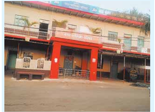
सिरोंज, दोपहर मेट्रो।

नगर पालिका परिषद के जिम्मेदारों की लापरवाही के कारण अधिकांश सड़कें भ्रष्टाचार की भेंट चढ़ती हुई दिखाई दे रही है आगे 5 पट पीछे सपाट की स्थिति में निर्माण कार्य हो रहा है फिर भी संबंधित विभाग के अधिकारी देखने के लिए नहीं पहुंच रहे हैं इसी बात का फायदा उठाकर अधिकांश ठेकेदारों के द्वारा घटिया निर्माण कार्य को अंजाम दिया जा रहा है। विधायक की फटकारों के बाद भी नगर पालिका के अधिकारी नहीं दे रहे हैं ध्यान कायाकल्प योजना की सड़क में हो रहा है गोलमाल घटिया निर्माण करने वालों की किसी भी तरह की कोई जांच पड़ताल नहीं की जा रही है। अपने हिस्सा से ठेकेदारों के द्वारा घटिया मटेरियल का उपयोग करके सी सी सड़कें बनाने के नाम पर खाना पूर्ति की जा रही दूसरी ओर कायाकल्प योजना के अंतर्गत करोड़ रुपए की लागत से सड़क का निर्माण कार्य बहुत ही घटिया किया जा रहा है। सड़क बनने के साथ ही जगह-जगह से उखड़ने लगी है बेस डालने के नाम पर खाना पूर्ति हो टेंडर के हिस्सा से काम नहीं किया जा रहा है गुणवत्ता का तो कोई ध्यान ही नहीं है। अपने हिस्सा से सीसी डाल दी जाती है कहीं पर बेस के नाम पर खाना