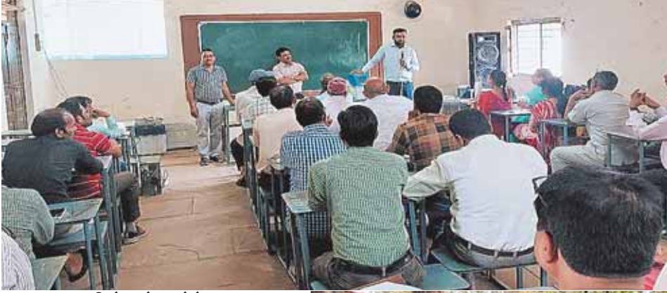
सिरोंज, दोपहर मेट्रो।

कलेक्टर एवं जिला निर्वाचन अधिकारी ने लोकसभा निर्वाचन के तहत सात मई को होने वाले मतदान के दौरान हरेक मतदान केन्द्र पर रोशनी के संबंध में कोई व्यवधान ना हो पाए इसके लिए जिले की सभी पांचों विधानसभाओं के कुल 1341 मतदान केन्द्रों पर चार्जबल एलईडी की व्यवस्थाएं सुनिश्चित कराने के निर्देश संबंधित विभागीय भवनों के जिला व खण्ड स्तरीय अधिकारियों को प्रेषित किए गए हैं।