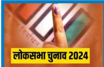
लोकसभा चुनाव 2024

चुनौती भी कम नहीं है। क्योंकि किसी सीट पर बागी ही खेल बिगाड़ रहे हैं तो किसी सीट पर एंटी इनकंबेंसी चुनौती बन रही है। बालाघाट और सीधी सीट पर बागी प्रत्याशी काँग्रेस और भाजपा प्रत्याशी के लिए परेशानी बन रहे हैं।