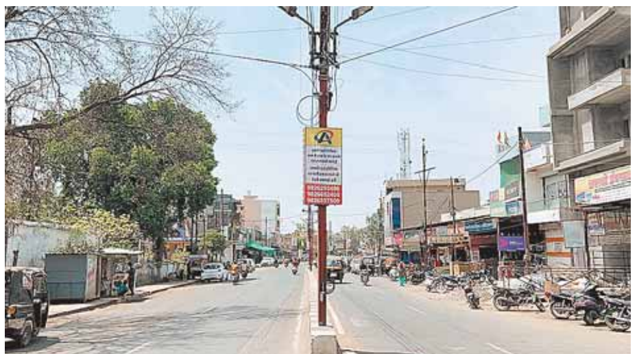
सिवनी मालवा, दोपहर मेट्रो।

नगरीय क्षेत्र में पत्थर पुल से लेकर बानापुरा तक बिजली विभाग के लगभग 50 खंबे हैं जिनमें से अधिकतर पर एक विज्ञापन एजेंसी द्वारा अवैध तौर पर कब्जा करके विज्ञापन के लिए होर्डिंग लगाए जा रहे हैं। बिजली विभाग सहित प्रशासनिक अधिकारी दिनभर वहां से निकलते हैं बावजूद इसके सभी अधिकारी इस बाद से अंजान हैं कि बिजली विभाग के खम्बो पर दिन दहाड़े अवैध होर्डिंग किसने लगाए।