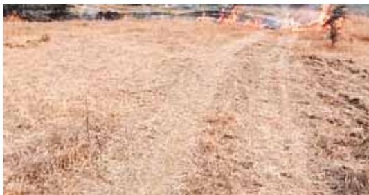
सीहोर, दोपहर मेट्रो।

गेंहू के टूट नरवाई जलाने से फसल उत्पादन में कमी