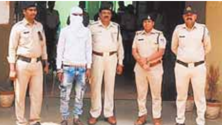
सिवनी मालवा, दोपहर मेट्रो