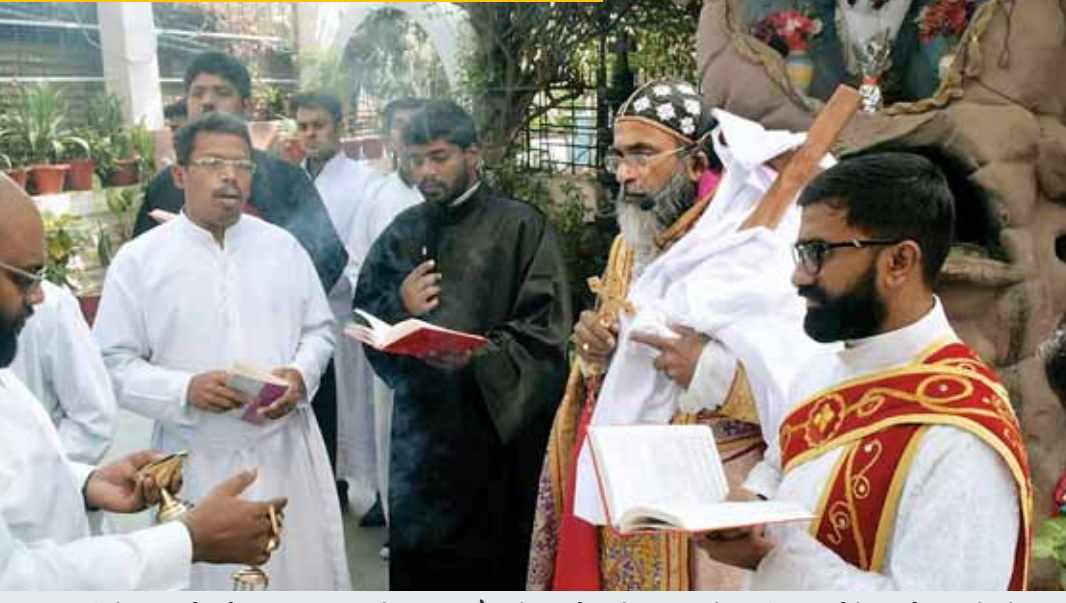
राजधानी में आज ईसाई समाज गुड फ्राइडे मना रहा है। भोपाल के अरेरा हिल्स सेंट थॉमस चर्च में प्रार्थना करते लोग।