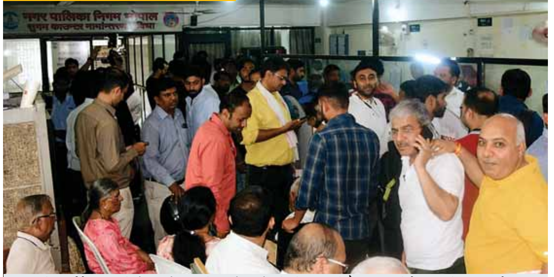
इस वित्तीय वर्ष के आखिरी दो दिन में रजिस्ट्री कराने वालों की भीड़ बढ़ रही है। आज छुट्टी के दिन भी रजिस्ट्रार के दफ्तर खुले हुए हैं और लोग अपनी संपत्ति की रजिस्ट्री की आपाधापी में हैं। वहीं नगर निगम कार्यालय भी आज काम कर रहे हैं और लोग अपना बकाया टैक्स जमा करने पहुंच रहे हैं।