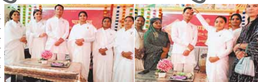
अर्थ नियम संयम का ज्ञान देते हैं दोनों ही कर्तव्य परमात्मा के हैं आधा कल्प के बाद द्वार युग से हम आत्माएं अपने पिता परमात्मा को सभी रूपों में, भाई रूप में भी याद करती आई हैं और पृथ्वी लोक में आ पधारने का निमंत्रण देती आई है परंतु वह समय भक्ति काल का होता है परमात्मा पिता के धरती पर अवतरण का नहीं। कलयुग के अंत में जब पाप की आती हो जाती है तब वे साधारण मानवीय तन का आधार ले अवतरित हो जाते हैं। आधा कल्प की पुकार का फल परमात्म अवतरण के रूप में पाकर हम आत्मायें धन्य हो जाती हैं हम धरती पर अवतरित बंधु रूप परमात्मा को दिल में समाकर स्नेह से भोग लगाती है, भगवान हमारे इस स्नेह को देख वरदानों से भरपूर कर देते हैं। और कहते हैं जो आत्मायें धरती पर अवतरित मुझ परमात्मा को पहचान कर सत्कार पूर्व आतिथ्य करेंगी, मेरी श्रीमंत पर चलेगी, उन्हें मैं सजाओं से सुख कर दूंगा। परमपिता परमात्मा को भाई मानकर चलना ही सदा सुखी रहना है कभी बहन को किसी प्रकार की परेशानी का सामने नहीं करना पड़ेगा। इस प्रकार यह लौहपर परमात्मा के साथ बन्धु का नाता जोड़ने और निभाने का यादगार है।

इस पर्व के संबंध में एक कथा प्रचलित है कहते हैं यमुना और यम दोनों बहन भाई थे। यम को यमुपुरी में आत्माओं के कर्मों के हिसाब किताब देखने और कर्म अनुसार फल देने की सेवा मिली यमुना अपने भाई यम को घर आने का निमंत्रण देती रहती थी। यमराज को रोय ही आत्माओं का लेखा-जोखा करना होता था। एक दिन भाई आने को वचनबद्ध हो गया। भाई को घर आया देख यमुना की खुशी का ठिकाना ना रहा बड़े ही प्यार से शुद्धिपूर्वक उन्हें भोजन करवाया। बहन के निश्चल स्नेह से प्रसन्न होकर यमराज ने वर मांगने को कहा यमुना ने कहा मैं सब रीति से भरपूर हूँ मुझे