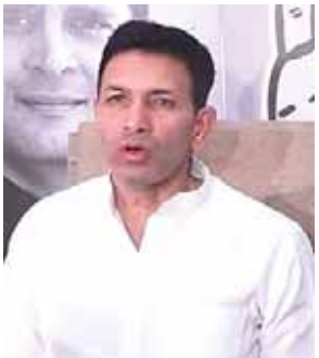
होकर भाजपा पर लगातार