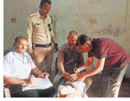
नर्मदापुरम, दोपहर मेट्रो