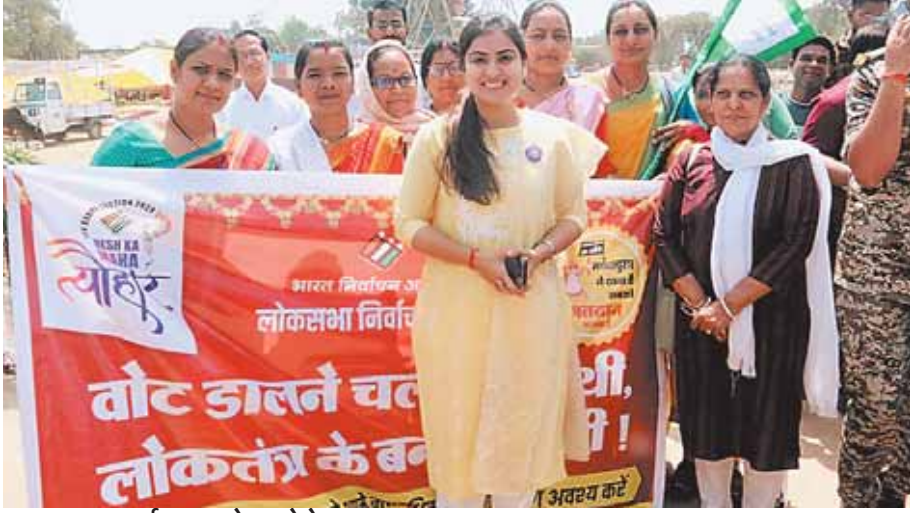
नर्मदापुरम, दोपहर मेट्रो

कलेक्टर ने लोकसभा निर्वाचन के तहत ग्राम पंचायत एवं तहसील स्तर पर क्या तैयारी की जा रही है, उसका निरीक्षण करने माखन नगर का भ्रमण किया। कलेक्टर ने जांच नाका, चेक पोस्ट ऑचल खेड़ा एवं नसीराबाद का निरीक्षण किया। तैनात अमले से आमने-सामने चर्चा की और आवश्यक निर्देश दिए। इसी कड़ी में कलेक्टर ने ऑचल खेड़ा के मतदान केंद्र क्रमांक 91, 92, 93, ग्राम समौन के मतदान केंद्र 61, 62 ग्राम गनेरा के मतदान केंद्र क्रमांक 17, 18 का निरीक्षण किया और मतदान केंद्रों में उपलब्ध मूलभूत सुविधाओं का अवलोकन किया। जहां कमी पाई गई वहां पर मूलभूत सुविधा उपलब्ध कराने के निर्देश संबंधित अधिकारियों को दिए।