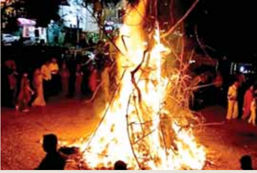
भोपाल, दोपहर मेट्रो।

मध्य क्षेत्र विद्युत वितरण कंपनी ने सभी बिजली उपभोक्ताओं तथा आम नागरिकों से सुरक्षित होलिका दहन के लिये अपील की है। कंपनी ने कहा है कि बिजली के खंभे, ट्रांसफार्मर या फिर बिजली की ऐसी लाइनों जिसमें विद्युत प्रवाहित होती है, उनके नीचे होलिका दहन न करें। लाइनों के नीचे होलिका दहन से दुर्घटना की संभावना सदैव बनी रहती है।