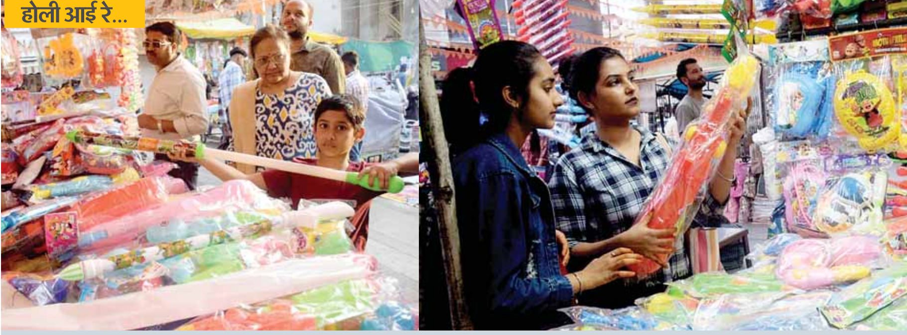
शहर के बाजारों में होली का बाजार सज गया है। पिचकारी व रंग गुलाल खरीदने लोग पहुंच रहे हैं।