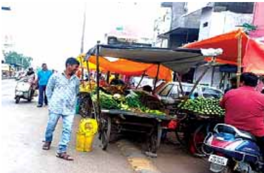
हिरवाराम नगर, दोपहर मेट्रो।

जनसंवाद कार्यक्रम में संतनगर की सड़कों पर ठेलों की समस्याओं को उठाए गया था। कार्यक्रम के लंबे समय बाद नगर निगम एक्शन में आया दो दर्जन ठेलों को सड़कों से हटाया। कार्रवाई के दौरान बहस की स्थिति भी बनी।