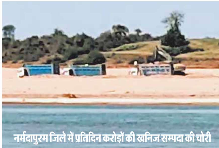
नर्मदापुरम जिले में प्रतिदिन करोड़ों की खनिज सम्पदा की चोरी

सिर्फ एक ढकोसला है। इन दिनों नर्मदापुरम जिले के तवा और नर्मदा नदी के प्रत्येक घाट से प्रतिदिन लाखों करोड़ों की रेत चोरी हो रही है। नर्मदा को प्रदेश की जीवनदायनी मानने वाले प्रदेश की सत्ता को सुशोभित कर रहे नेतागण भी सिर्फ प्रदेश की जीवन रेखा शब्द को मात्र कहने और लिखने तक ही सीमित मान रहे हैं।