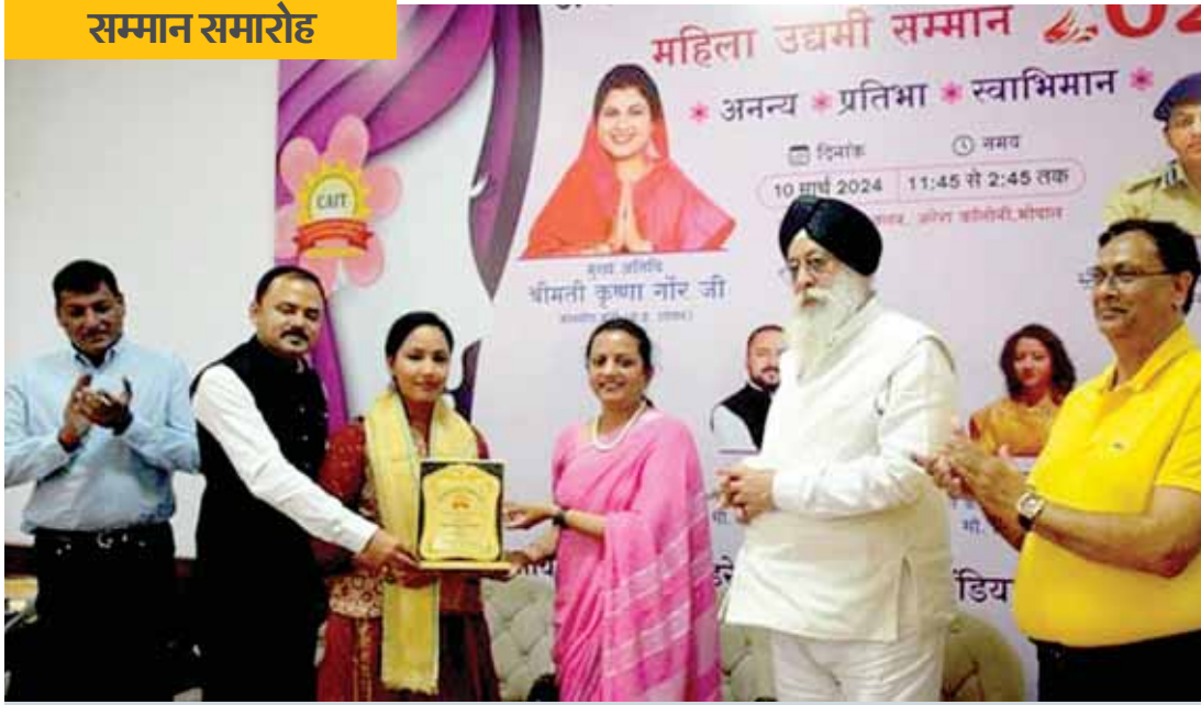
भोपाल के भोजपुर क्लब में अंतर्राष्ट्रीय महिला दिवस के उपलक्ष्य में महिला उद्यमी सम्मान समारोह का आयोजन किया गया।