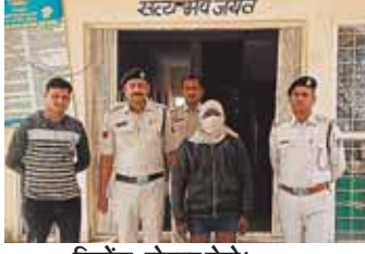
सिरोंज, दोपहर मेट्रो।

ग्रामीण तथा चौकीदार की मदद से मिली सफलता