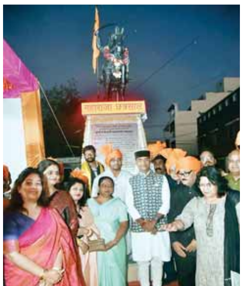
भोपाल के छत्रसाल नगर में महाराजा छत्रसाल की प्रतिमा का लोकार्पण मंत्री विश्वास सांरंग ने किया।

आरएसके द्वारा लघु उद्योग निगम प्रबंधन संचालक को लिखे गए पत्र में गया है कि हरदा जिले में 60 माध्यमिक शालाओं में 3141 फर्नीचर (डेस्क एवं बेंच) भेजे गए हैं। जिसमें डेस्क-92, बेंच 36 खराब स्थिति के पाए गए हैं। प्रदायकर्ता द्वारा डेस्क-80, बेंच-27 बदल दी गई हैं। फर्नीचर सेट को निर्धारित मानक, गुणवत्ता, सुदृ? अच्छे स्थिति एवं शालाओं हेतु निर्धारित फर्नीचर संख्या अनुसार प्रदाय किया जाना सुनिश्चित करें। संबंधित प्रदायकर्ता (वेण्डर) के विरुद्ध नियमानुसार कार्यवाही किया जाना उचित होगा। इसी प्रकार की स्थिति यदि अन्य जिलों में भी हो तो उक्तानुसार सही गुणवत्ता का फर्नीचर बदल कर उपलब्ध कराया जाना सुनिश्चित किया जाए।