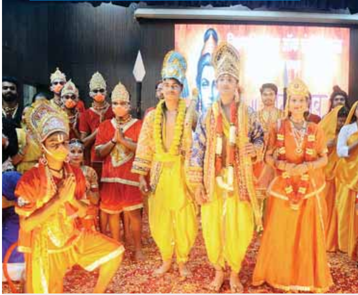
भोपाल। कृष्ण भवन सभागार में विक्रमादित्य गुप्त का इंस्टीट्यूशन के होनहार विद्यार्थियों द्वारा राम उत्सव राम एक राष्ट्र पुरुष पर व्याख्यान एवं रामचरित का मंचन किया गया जिसमें रामोत्सव मंचन में मर्यादा पुरुषोत्तम श्री राम भगवान जो कि विष्णु के सातवें अवतार हैं उन्होंने क्रेता युग में रावण का संहार करने के लिए धरती पर अवतार लिया।