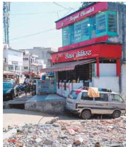
बिना अनुमति का कैसे बन गया मेडिकल स्टोर भवन?

मीनाक्षी चौक की सड़क को चौड़ी करने के लिए सड़क के आसपास स्थापित दुकानदारों को हटाया गया। लेकिन इसी रोड पर रॉयल केमिस्ट नाम का एक मेडिकल स्टोर अनाधिकृत रूप से संचालित है। इस मेडिकल स्टोर भवन को नगर पालिका द्वारा अनापति प्रमाण पत्र भी जारी नहीं किया गया। यह दवाई की दुकान एक नाले के ऊपर बनी हुई है। बरसात के दिनों में इस नाले में अधिक बाढ़ आ जाने से आसपास के क्षेत्र में पानी फैल जाता है। जिस दिन मीनाक्षी चौक से अतिक्रमण हटाने की कार्रवाई की जा रही थी उस दिन अधिकारियों को दिखाई नहीं दिया कि यह भवन भी अनाधिकृत रूप से अतिक्रमण की चपेट में है। इस कार्यवाही से साफ जाहिर है कि या तो अतिक्रमण हटाओ दल द्वारा जानबूझकर अतिक्रमण को चिन्हित नहीं किया गया या फिर राजनीतिक दबाव से इस अनाधिकृत प्रतिक्रमण को नहीं तोड़ा गया। एक और तो शासन कहता है कि हम निष्पक्षता पूर्ण कार्रवाई करेंगे वहीं दूसरी ओर इस प्रकार पक्षपात पूर्ण कार्रवाई करके लोगों को कहने का मौका दिया जा रहा है।