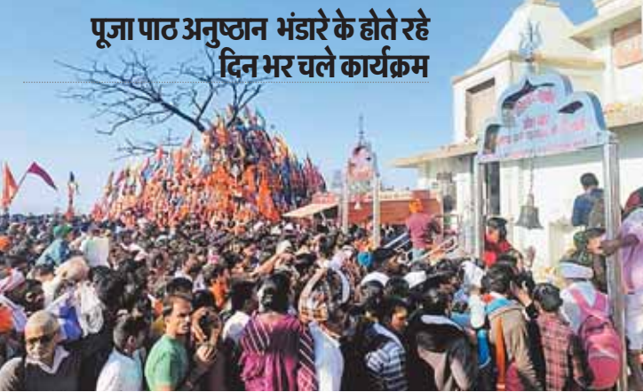
नर्मदापुरम, दोपहर मेट्रो

नर्मदापुरम महाशिवरात्रि का पर्व आदि शक्ति जगदंबा और महादेव शिव की आराधना का पर्व है। हमेशा की तरह इस वर्ष भी नर्मदापुरम जिले में हर्ष और उल्लास के साथ महाशिवरात्रि का महापर्व मनाया गया। प्रभात काल से ही शिव मंदिरों में पूजा पाठ अनुष्ठान के कार्यक्रम शुरू हुए जो देर रात तक जारी करेंगे। अनेक स्थानों पर दिनभर भंडारी प्रसादी वितरण के कार्यक्रम होते रहे।