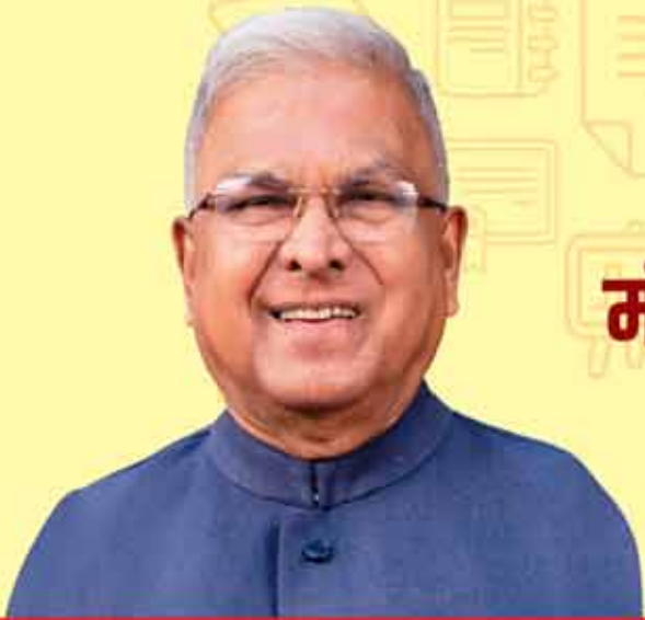
अध्यक्षता मंगुभाई पटेल राज्यपाल