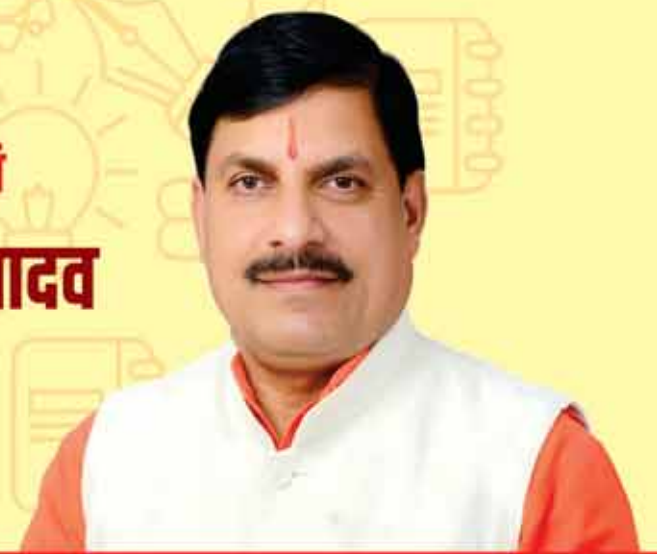
मुख्य अतिथि डॉ. मोहन यादव मुख्यमंत्री