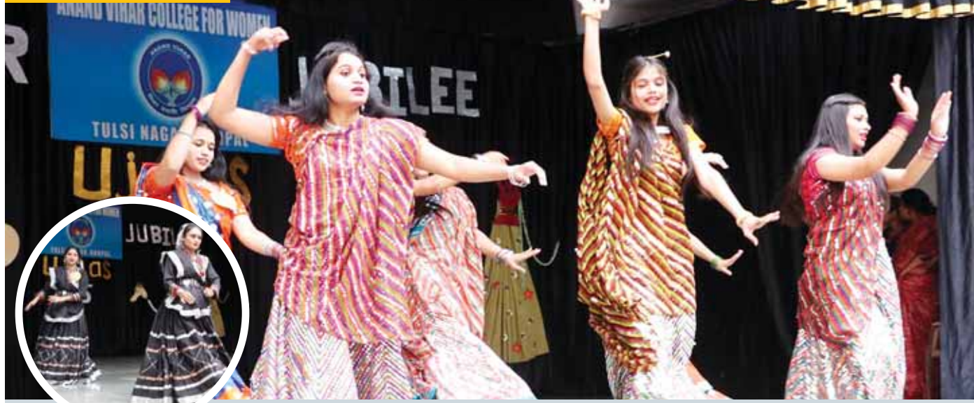
भोपाल। आनंद विहार कॉलेज में वार्षिक उत्सव के दौरान छात्राओं ने आकर्षक नृत्य प्रस्तुति दी।

आज से शुरू हुआ अभियान, आंगनबाड़ियों में नियमित टीकाकरण वाले दिन लगेंगे टीके