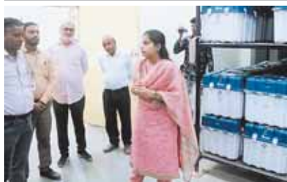
नर्मदापुरम, दोपहर मेट्रो

मतगणना केंद्र संभागीय आईटीआई का किया निरीक्षण