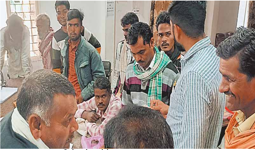
सिरोंज, दोपहर मेट्रो।

मुख्यमंत्री कन्यादान योजना विवाह और निकाह के लिए फॉर्म जमा करने का काम हो रहा है। पहले हुए घोटाले के बाद इस बार बड़ी सावधानी के