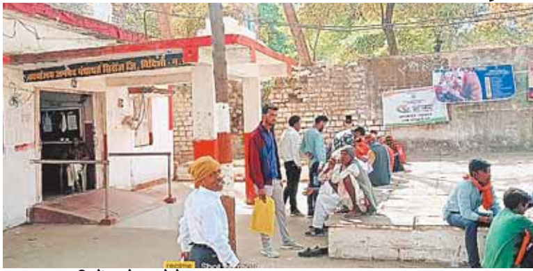
सिरोंज, दोपहर मेट्रो।

शासन की अधिकांश योजनाओं का संचालन जनपद पंचायत के माध्यम से होता है। जिसमें कई पद वर्षों से 68 अधिकारी कर्मचारियों के पद खाली पड़े हुए हैं उनमें महत्वपूर्ण पद भी शामिल हैं। कुछ पद ऐसे हैं इनके न होने के कारण ग्राम पंचायत में विकास के नाम पर गोलमाल हो रहा है पर उनको देखने वाला कोई नहीं है। ग्रामीण शासन की योजनाओं का लाभ पाने के लिए जनपद कार्यालय और सीईओ के कार्यालय के चक्कर लगाते हैं। यदि इन पदों की